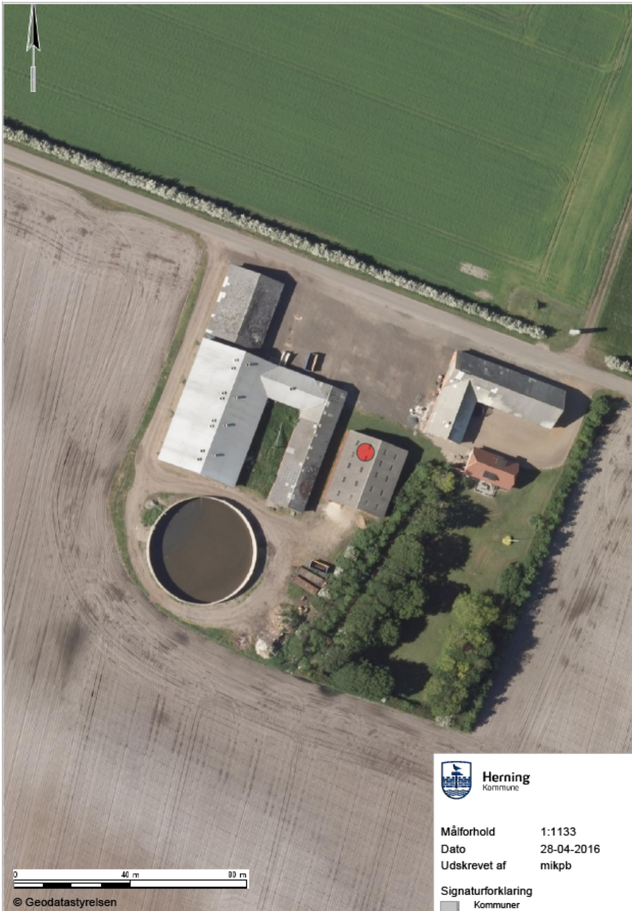
Bilag 1: Oversigt over ejendommen, gyllebeholdere, siloer osv.