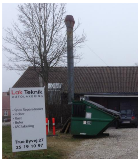
Fig. 2 Afkast fra sprøjtekabine