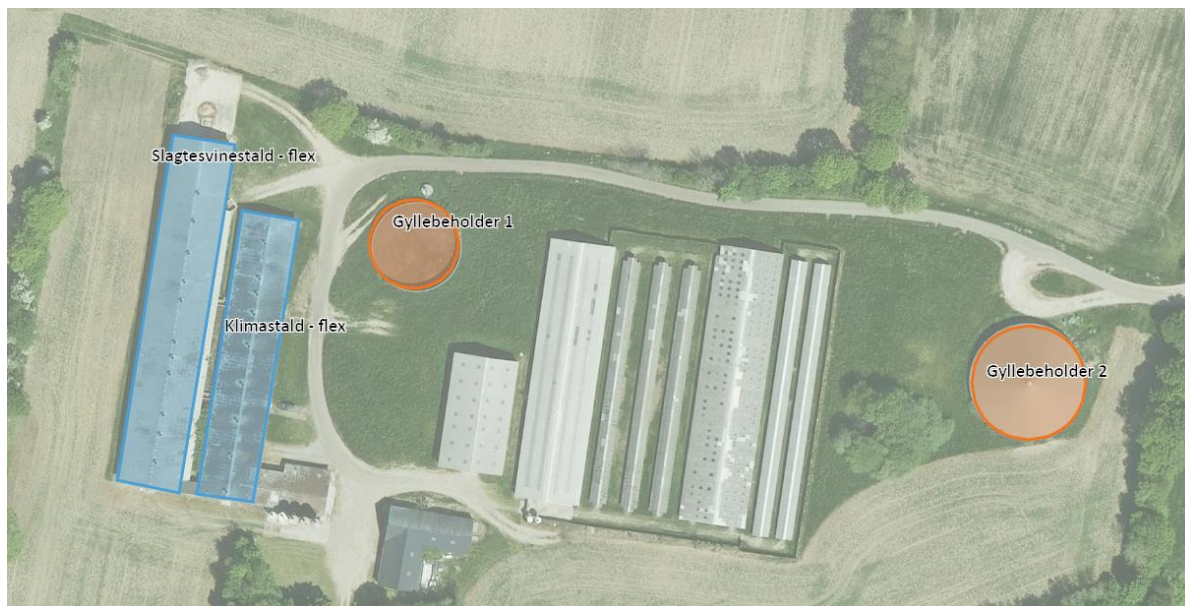
Figur 2. Oversigtskort over produktionsarealer (blå) og gødningsopbevaringsanlæg (orange) på Ballegårdsvej 20, Vamdrup