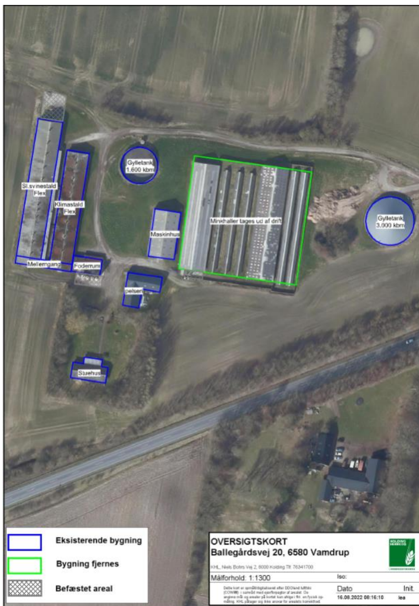
Figur 1. Situationsplan over anlægget.

Ændringen sker i eksisterende anlæg. Den eksisterende minkproduktion nedlægges, og hallerne fjernes.