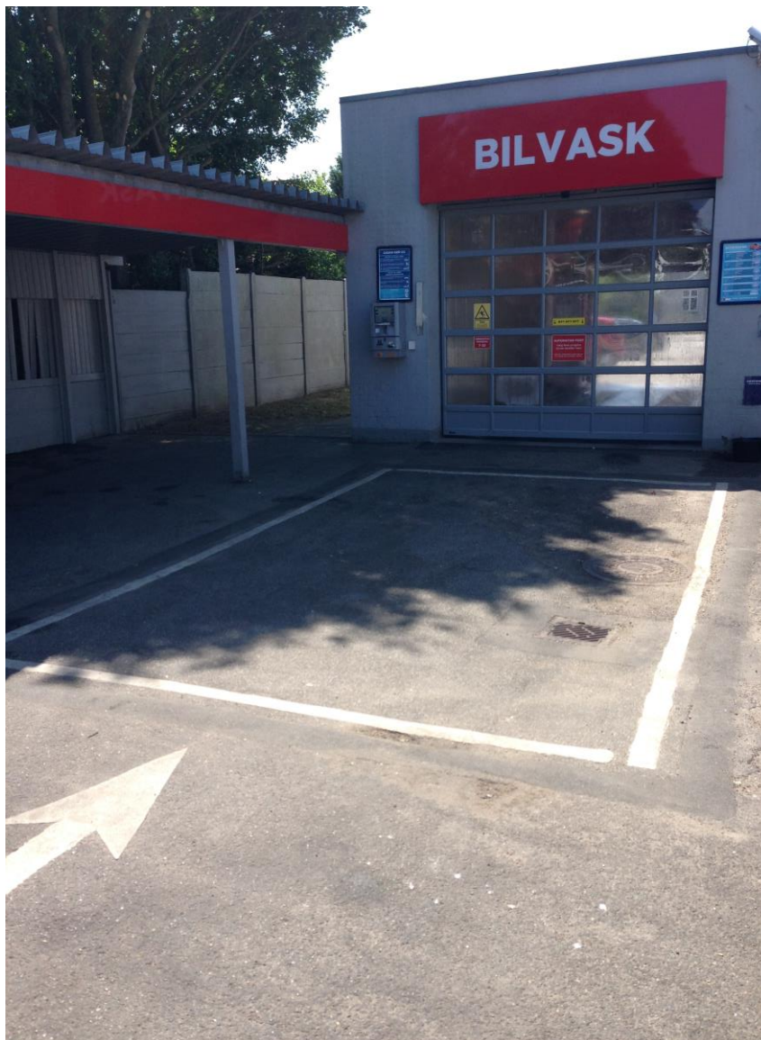
Forvaskeplads foran vaskehal

Virksomheden ligger i et separatkloakeret område, hvor spildevand afledes til renseanlæg og overfladevand afledes direkte til recipient. Ved miljøtilsynet kan det konstateres, at virksomheden har gennemført den planlagte og accepterede ændring af forvaskepladsen, så vaskevandet afledes til spildevandssystemet fra en plads med et areal på ca. 6 x 4 meter med forhøjet belægning i kanten - fremfor til regnvandssystemet som tidligere konstateret – se nedenstående foto.