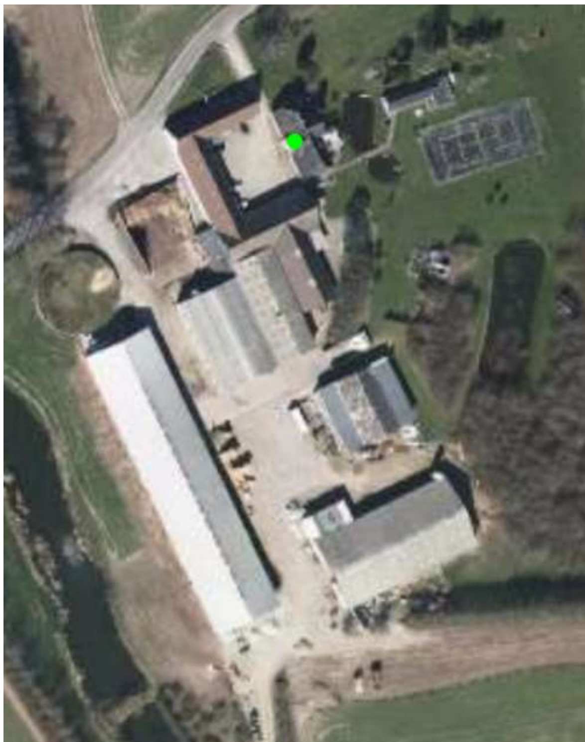
Krengerupvej 84, 5690 Tommerup