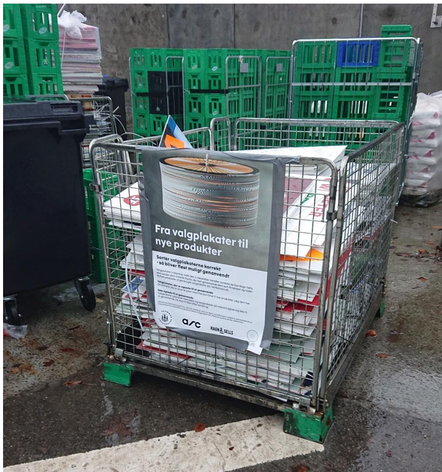
Bur til valgplakater