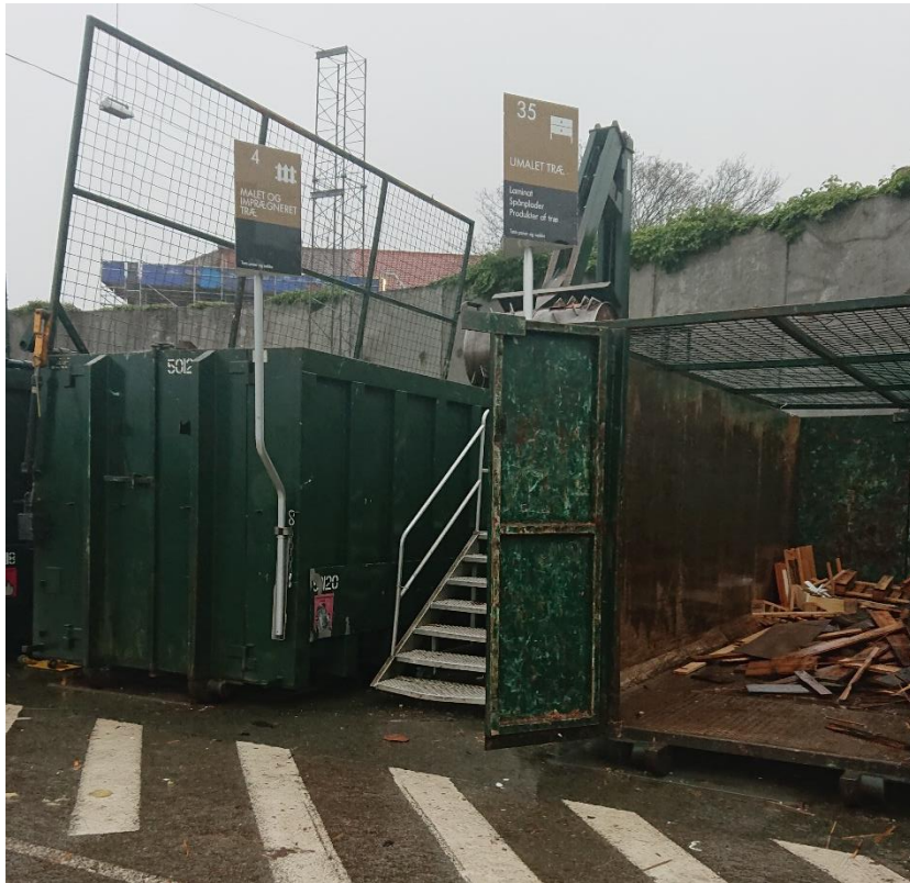
Containere til affaldstræ