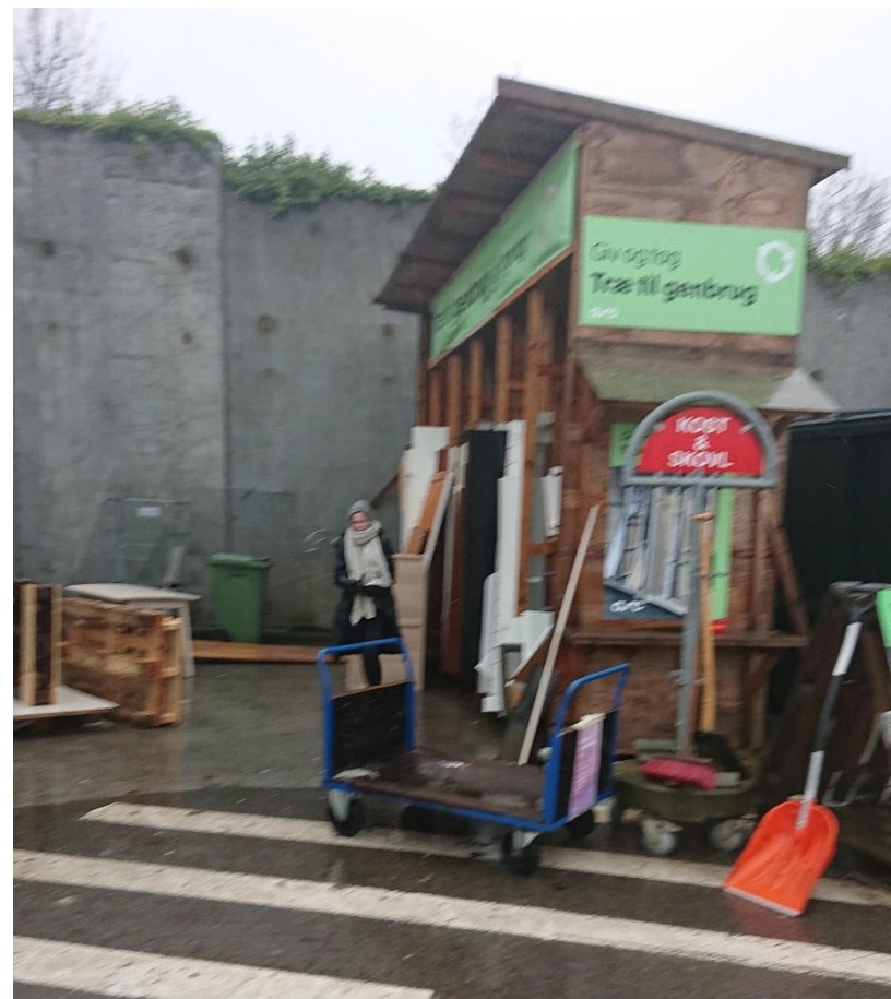
Område til genbrugstræ til og fra borgere