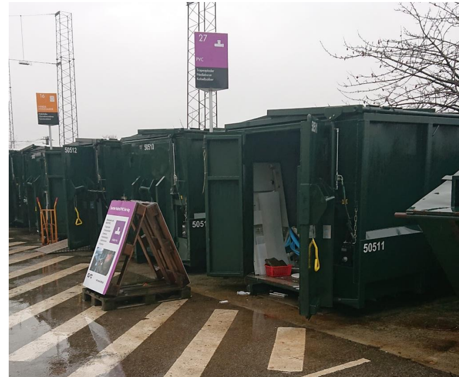
Container til PVC