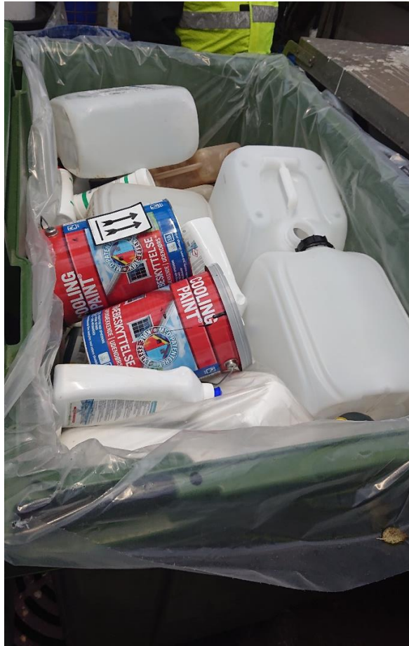
Tomme beholdere/dunke til farligt affald