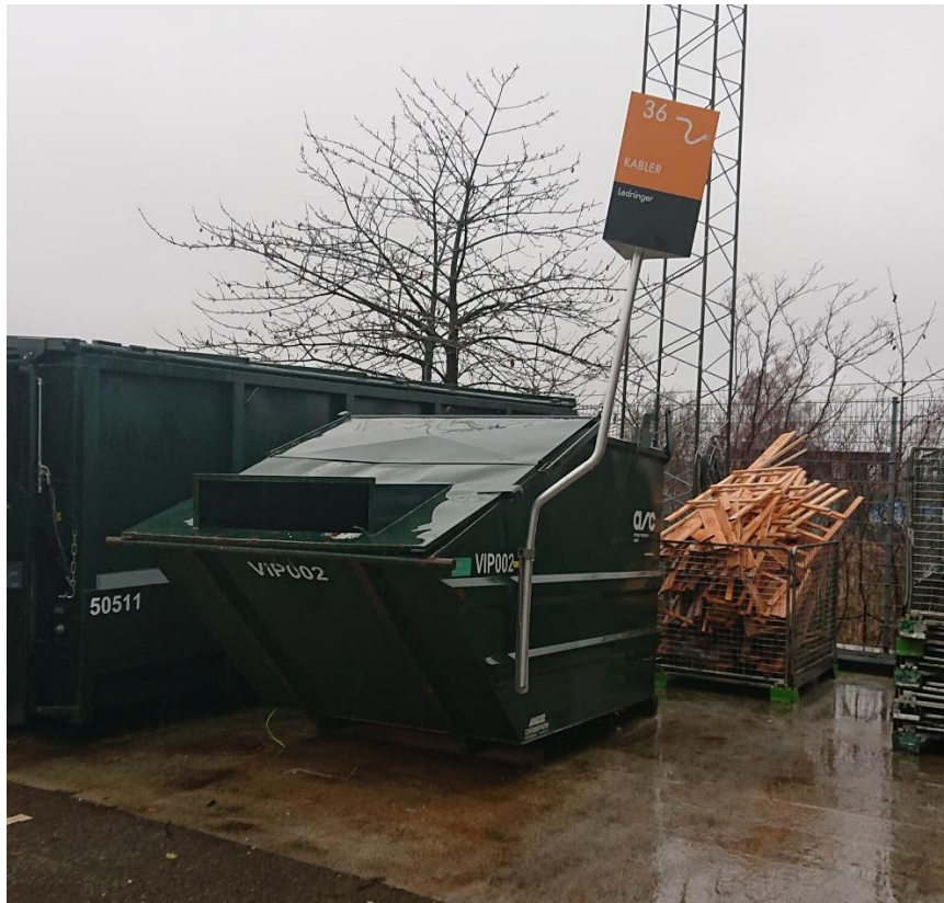
Container til kabler