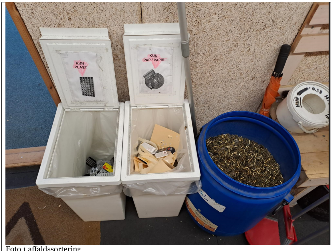
Foto 1 affaldssortering