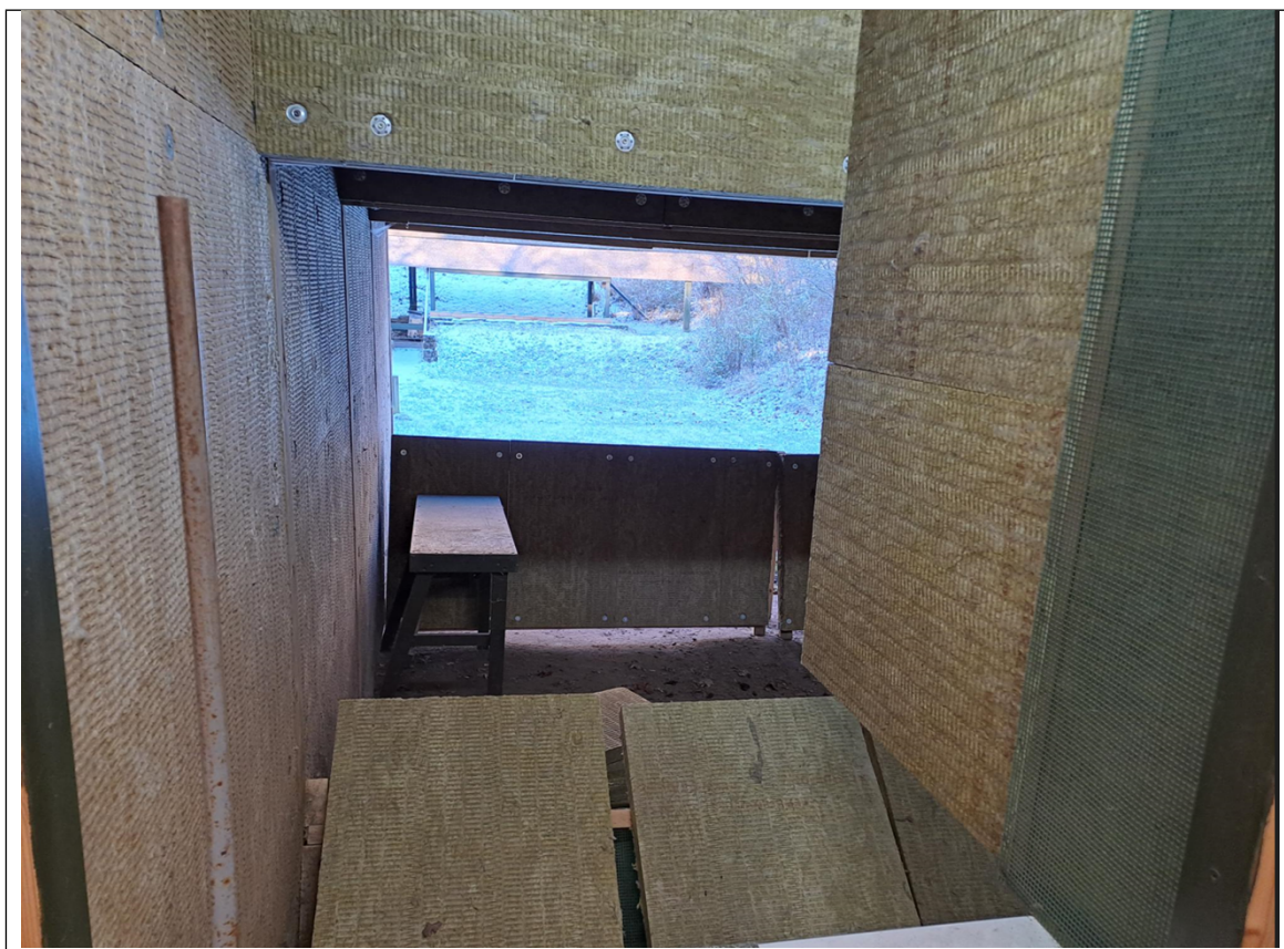
Foto2 Støjdæmpning af standplads på 50 meter banen