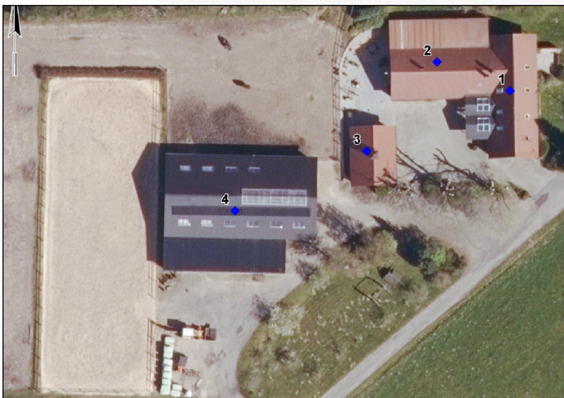
Figur 2. Eksisterende anlæg på ejendommen Kærvej 10, 8700 Horsens. Bygning 4 anvendes både nu og fremadrettet som stald.

Dyreholdet er omfattet af både husdyrbruglovens og husdyrgødningsbekendtgørelsens regler. Afstandskravene i husdyrbruglovens §§ 6, 7 og 8 skal derfor overholdes.