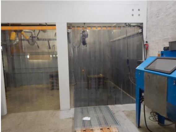
1. Nyt indendørs lokale til afvaskning af olie på motordele.