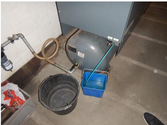
3. Kompressor med spand til kondensvand.