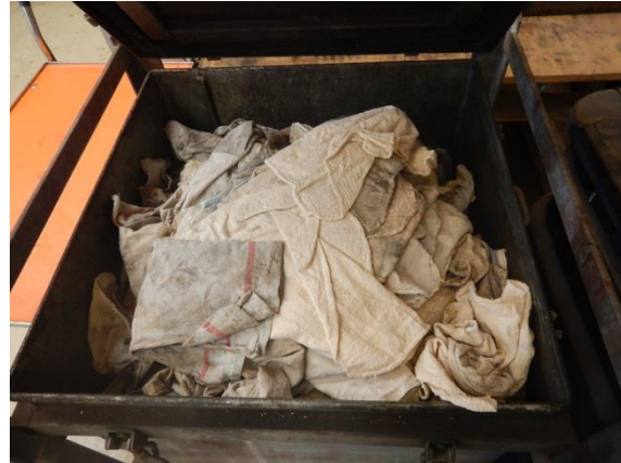
2. Olieklude til genanvendelse.