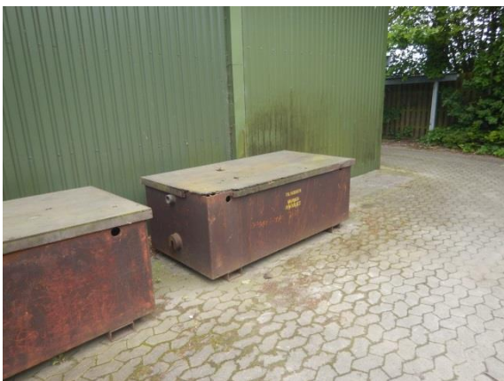
5. Beholdere til metallaftald.