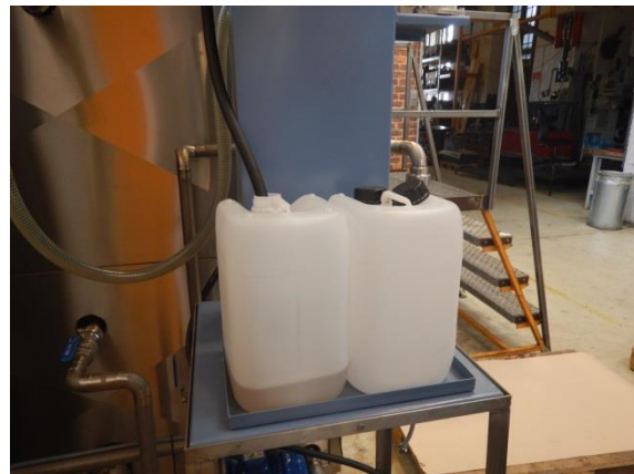
4. Dunke til opsamling af olievand fra vaskemaskine.