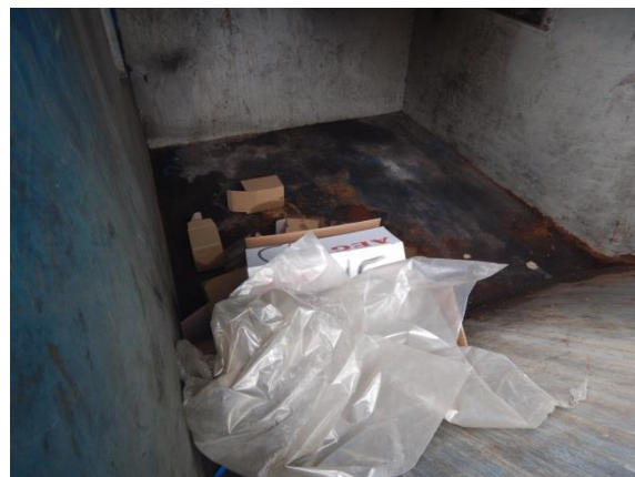
6. Brændbart affald – heriblandt pap.