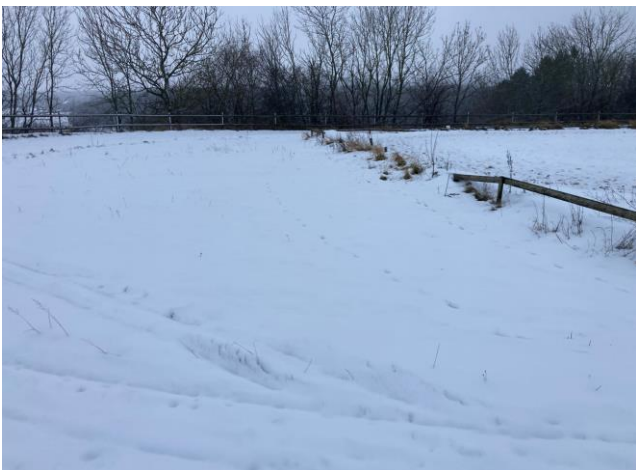
Foto 6. Foldene var snedækkede på tidspunkt for tilsynet. Overfaldisk afstrømning af vand kan ske fra fold og hen over ridebane til naboskel.