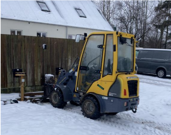
Foto 4: gravemaskine med forlygter som anvendes til lejlighedsvis mobil belysning af ridebanen.