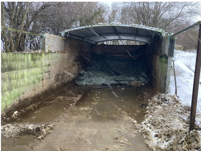
Foto 1. Møddingsplads.