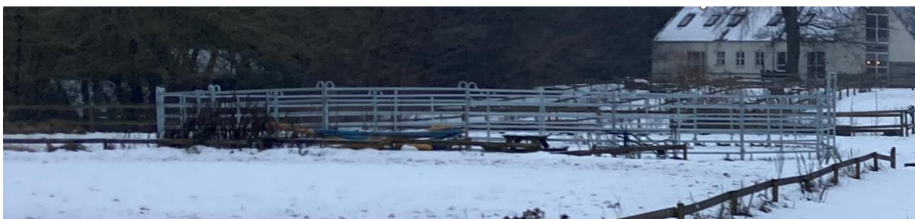
Foto 3: Roundpen i stål. Set på tidspunkt for tilsynet. Nedtaget efterfølgende.