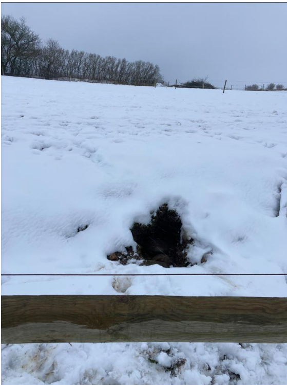
Foto 5. Foldene var snedækkede på tidspunkt for tilsynet. Overfaldisk afstrømning af vand kan ske på folde eller ridebane, eller som her fra erosionshul, som er placeret SØ for ridebanen og med ca 45 m til naboskel.