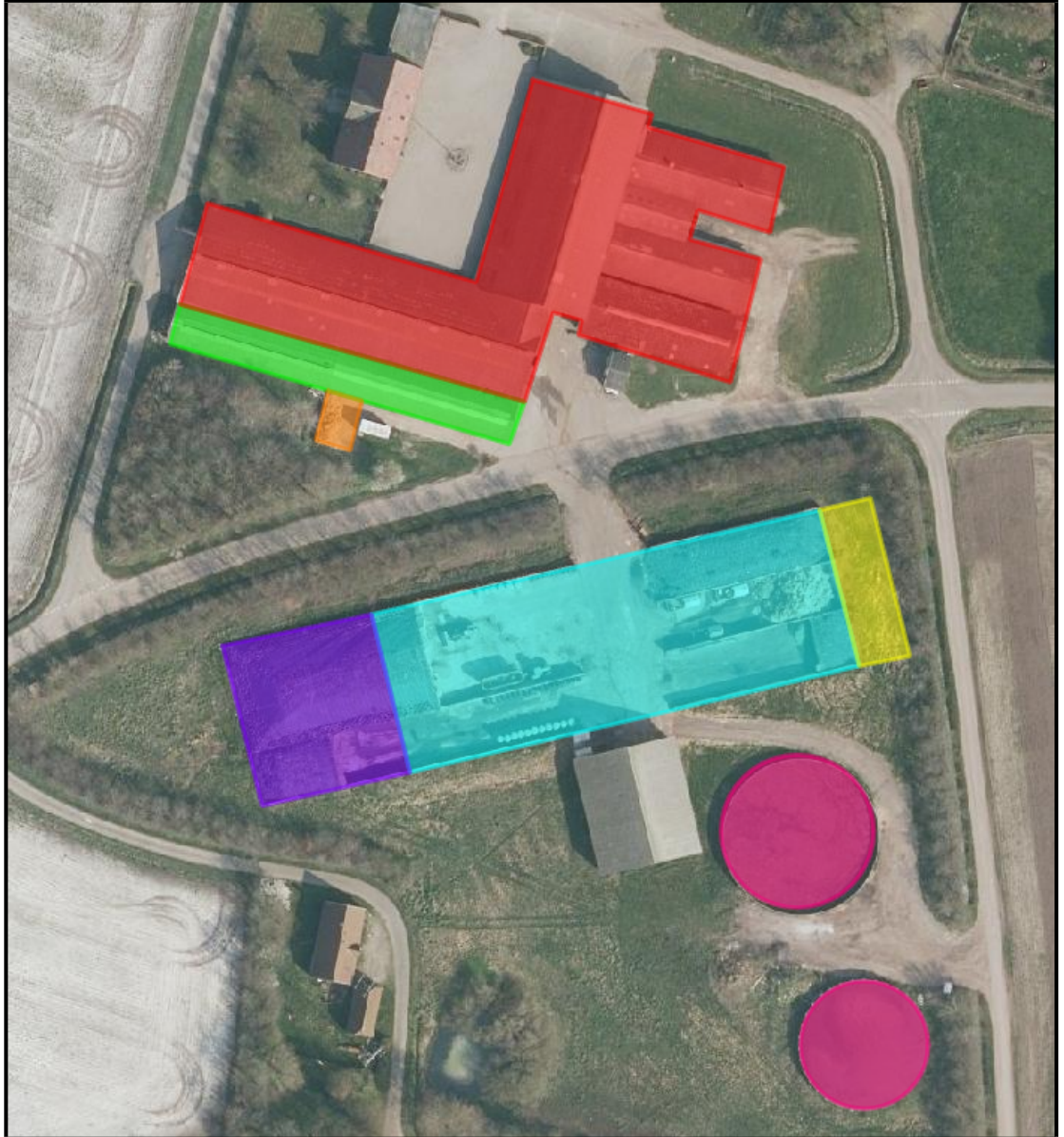
Figur 1: Placering af staldafsnit, ensilage- og gødningsopbevaringsanlæg

Oplysninger om ejendommens indretning og drift fremgår af nedenstående figur 1 og tabel 1.