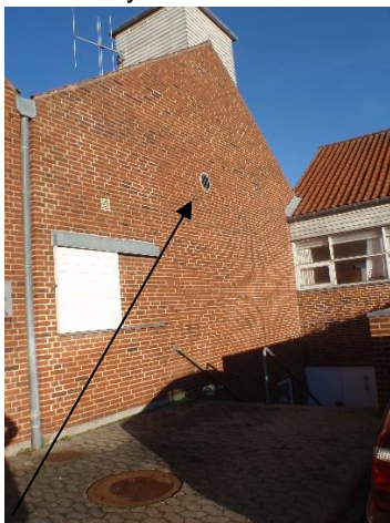
Afkast for udsugning af udstødningsgasser.

Ved tilsynet blev der ikke konstateret væsentlige støv- eller lugtgener. Kommunen har ikke modtaget klager over støv- eller lugtgener siden sidste tilsyn.