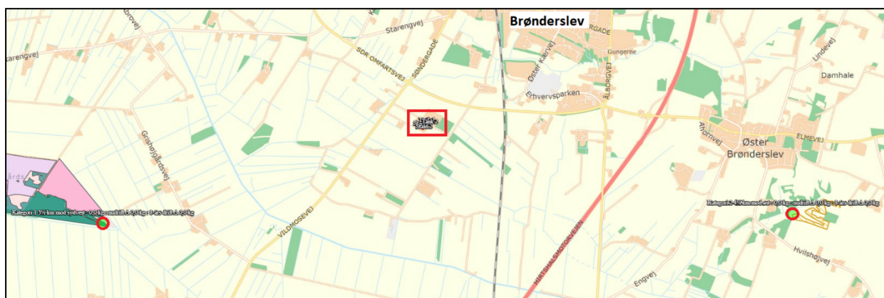
Figur: Natur i kategori 1 og 2, hvori der er beregnet deposition af ammoniak-kvælstof fra husdyrbruget på Vildmosevej 21. Beregningspunkterne er vist med røde cirkler. Husdyrbruget er vist med rød firkant.

Dernæst er det beregnet, hvor meget ammoniak-kvælstof fra husdyrbruget der deponeres i de nærmest-liggende kategori 1- og 2-naturområder. Naturområderne er vist på kortet i figuren nedenfor, og resultaterne er vist i tabellen.