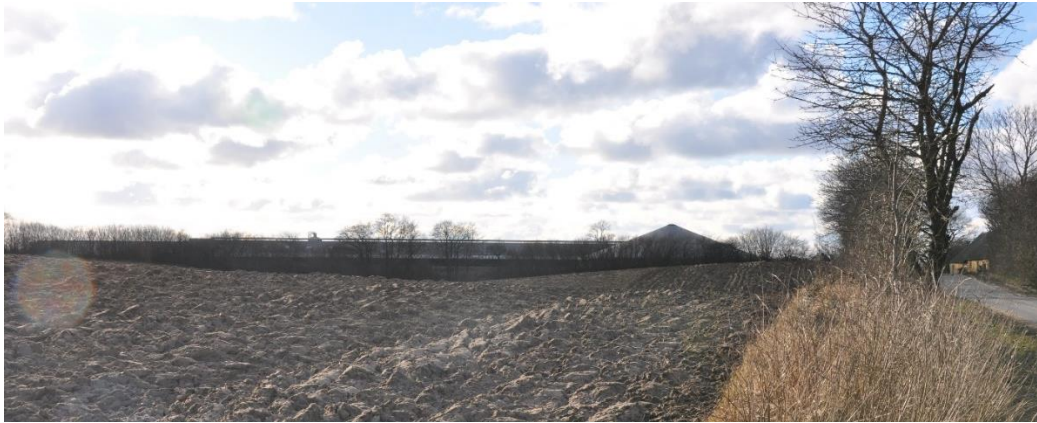
Foto af Bøllelosevej 21, set fra den blinde vej Bøllelosevej. Taget den 26/2-18.

Ejendommen Bøllelosevej 21 ligger for enden af den blinde vej Bøllelosevej, se foto nedenfor.