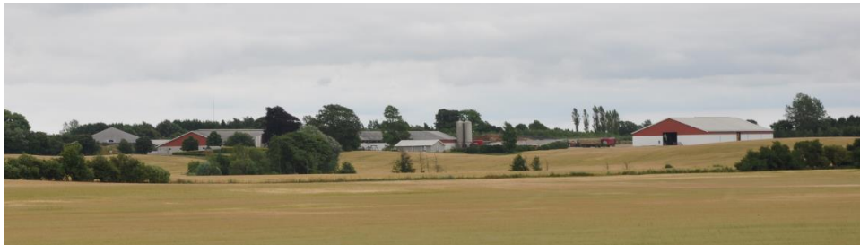
Bøllelosevej 21, set (med zoom) fra vejen Bøllelosen vest for produktionen. Foto taget 5/7-18.