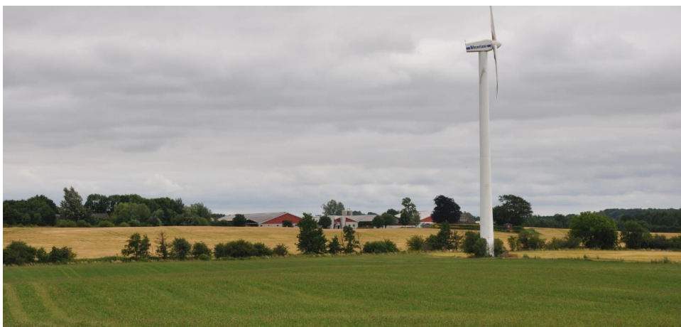
Bøllelosevej 21, set fra vejen Ryttergårdsvej nord for produktionen. Den østligste af en gruppe på 3 vindmøller ses også. Foto taget 5/7-18.

Det ansøgte maskinhus er oplyst til at have en kip højde på 8,4 m og de 2 kornsiloer er planlagt til en højde på 13 m. Maskinhuset og de 2 kornsiloer opføres i tilknytning til den eksisterende bebyggelse.