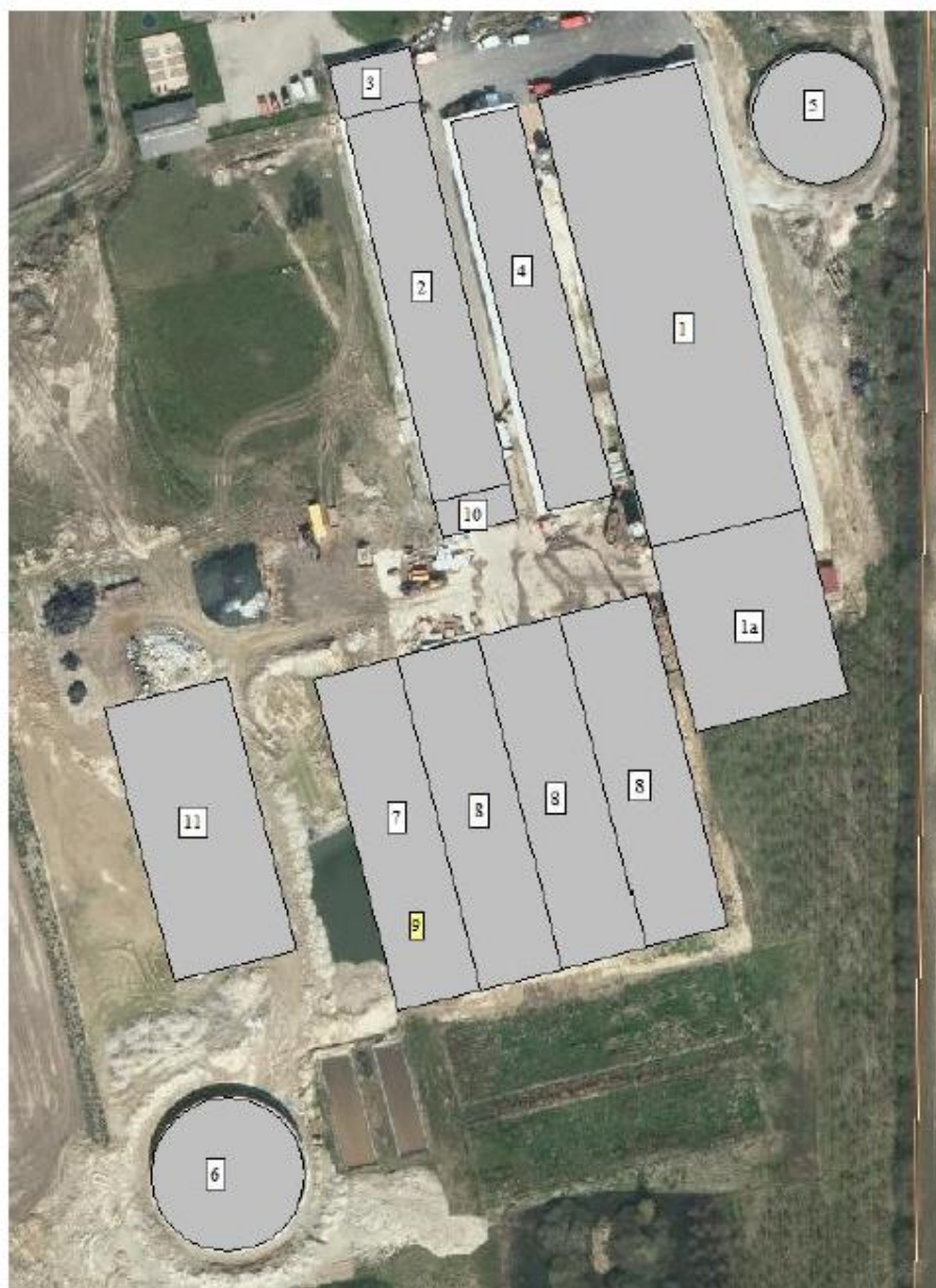
Figur B1. Oversigtskort over produktionsanlægget.

Bygning 1a: Tilbygning ansøgt d. 27. februar 2017.