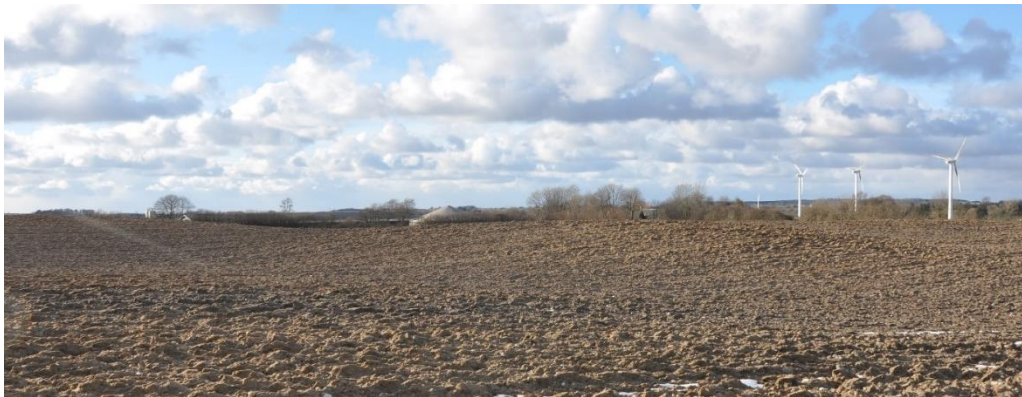
Bøllelosevej 21, set fra det højeste sted på Bankevej. 3 vindmøller ses yderst til højre. Foto taget 26/1-18.

Husdyrproduktionens driftsbygninger ligger på kanten af det kuperede landskabsområde Gudbjerg Dødislandskab, der støder op til det tidligere moseområde Bøllelosen (landskabsområde Stokkebæk Ådal). Set fra den nærmeste vej Bankevej i Landskabsområde Gudbjerg Dødislandskab, kan ejendommen kun lige anes bag det bakkede terræn, og sløres yderligere af det levende hegn i skel, se foto nedenfor.