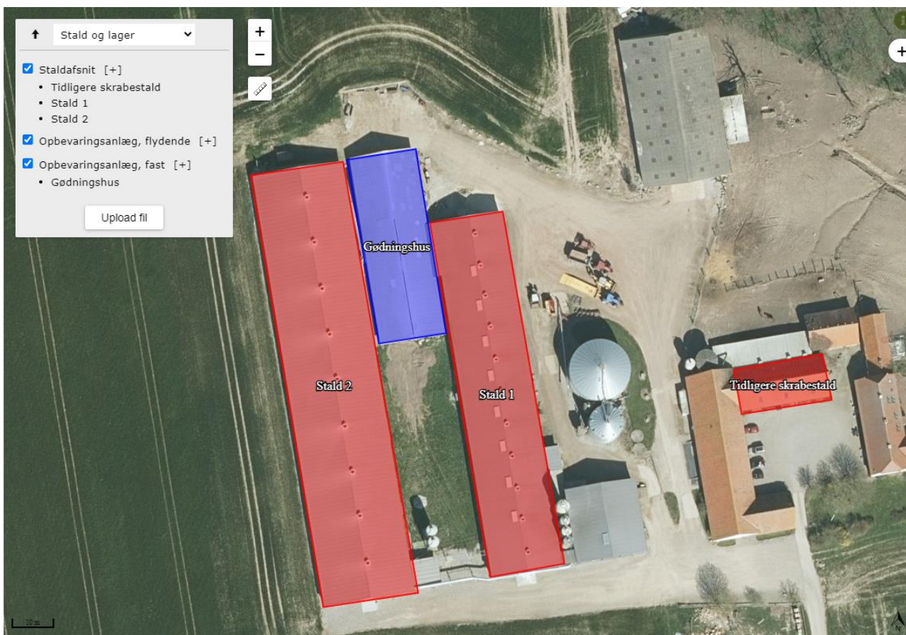
Figur 1. Oversigtskort over produktionsarealet på Drejensvej 31.

IE-husdyrbruget på Drejensvej 31, 6000 Kolding påbydes i henhold til § 39, jævnfør § 41 og § 43 a i husdyrbrugloven nedenstående vilkårsændringer i forhold til miljøgodkendelsen fra 2015 med tilhørende tillæg.