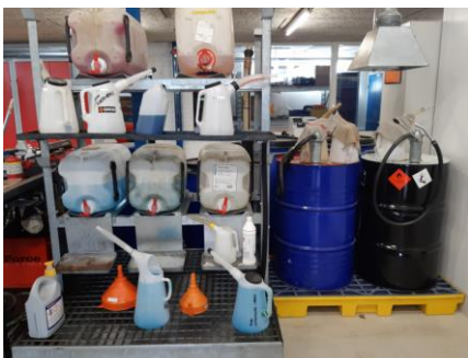
opbevaring af diverse på værkstedet.