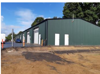
Udgravning med plads til vaskehal. Bagved bygning, der er udlejet.