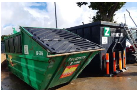
pap og jern