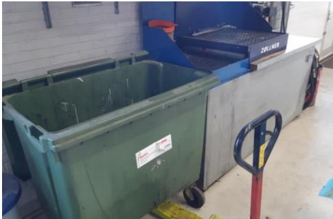
Bordtank og container til oliefiltre

I værkstedet er 2 bordtanke til spildolie - på henholdsvis 1200 liter og 1500 l. De er fra 2016.