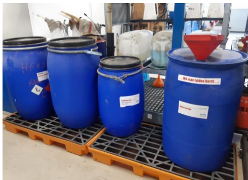
affaldsopbevaring på værkstedet i spændelågsfade på spildbakker.