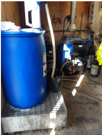
container med vaskeudstyr.