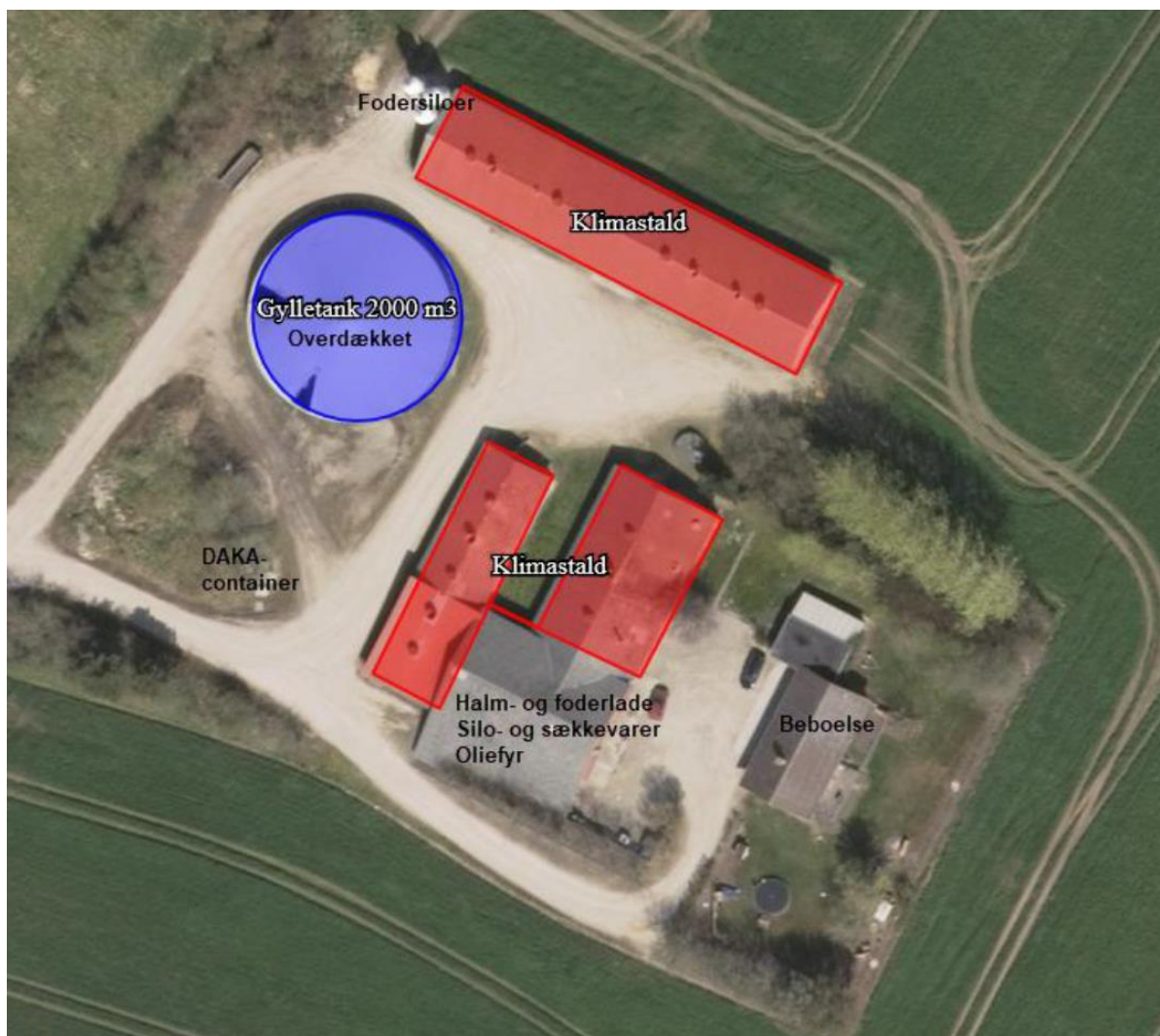
Figur 1: Oversigtskort over ejendommen