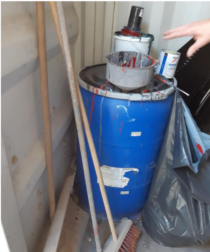
Brugt farve samles i tromle.