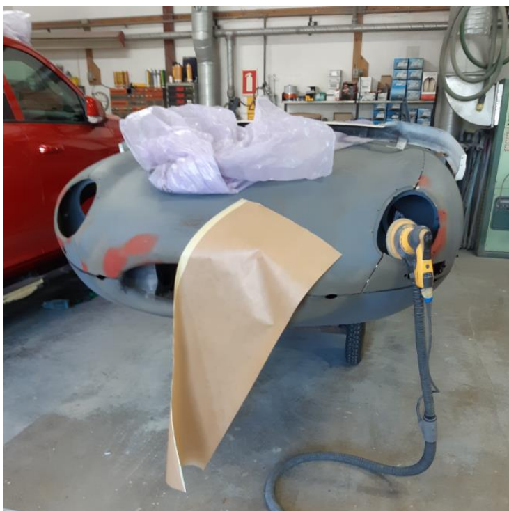
Igangværende opgave. Til højre u hullet efter lugten ses slibeudstyr med støvsuger påmonteret