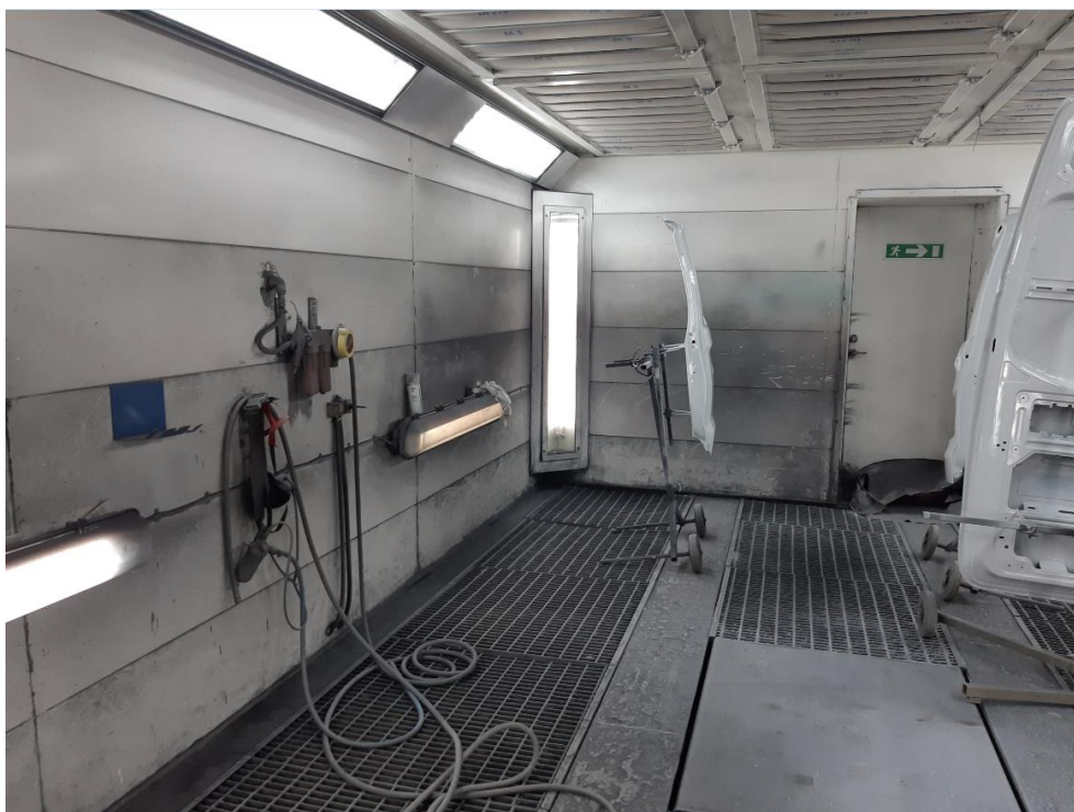
Sprøjtekabine. Udsugning med filtre findes under ristene i gulvet