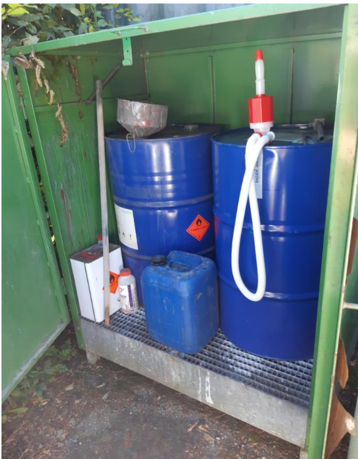
Kemiskab med spildbakke til nye og brugte produkter, placeret udendørs.