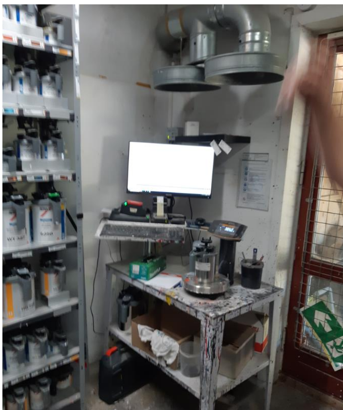
Lager og blandestation/påfyldning af farver på sprøjteudstyr