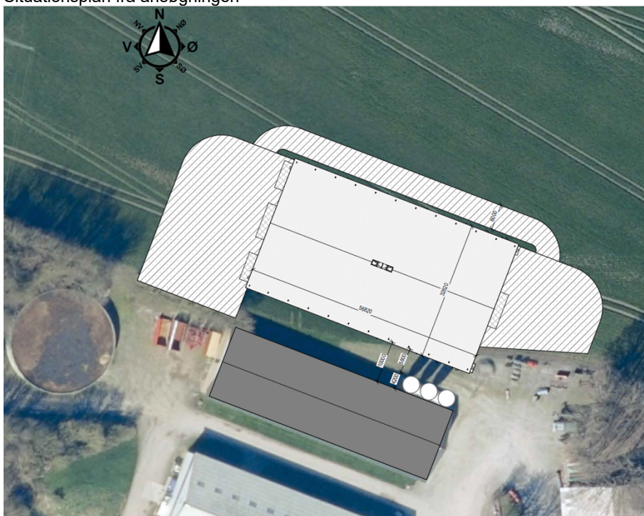
Situationsplan fra ansøgningen

På den baggrund er det Kerteminde Kommunes vurdering, at maskinhuset opføres i tilknytning til eksisterende bebyggelse.