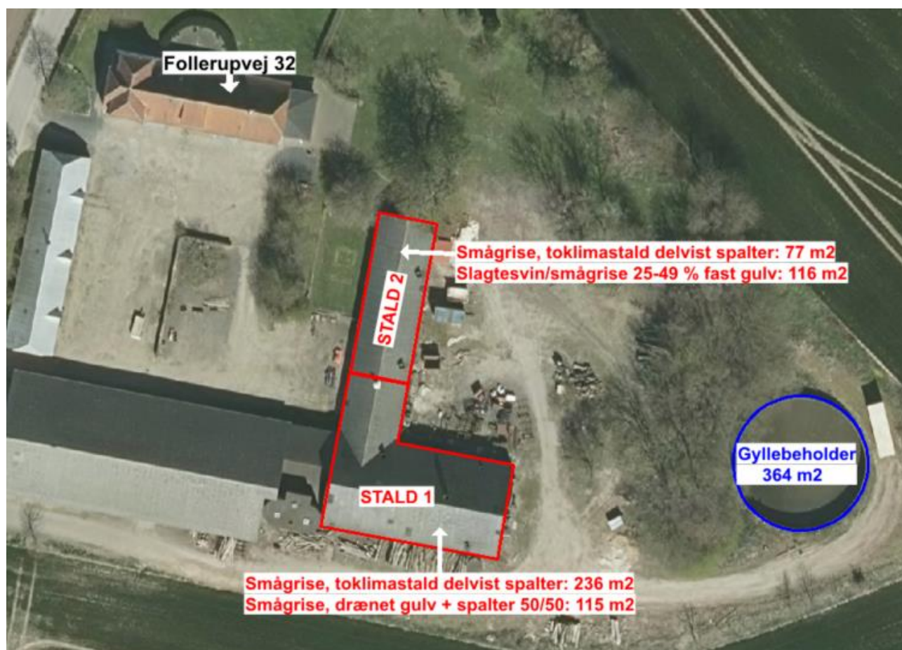
Figur 3. Stalde og gyllebeholder på Follerupvej 32