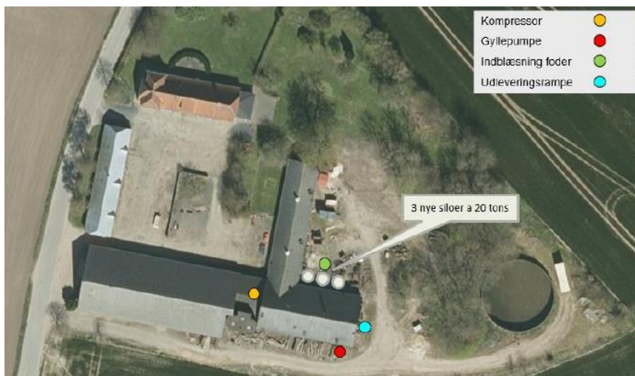
Figur 5. Støj- og støvkilder

Fredericia Kommune vurderer med de fastsatte vilkår, at husdyrbruget ikke vil medføre væsentlige støjgener for de omkringboende.