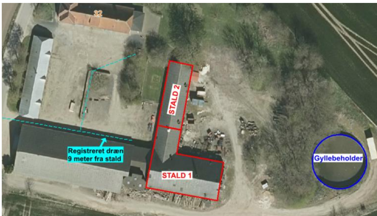
Figur 4. Drænledninger registreret på ejendommen

De eksisterende stalde ligger 9 meter fra en registreret drænledning på ejendommen. Der foreligger ikke oplysninger om der er tale om lukkede rør, f.eks. til bortledning af regnvand. Bygningerne står registreret i BBR som stalde, opført hhv. år 1900 og 1957, og formodes derfor at være lovligt opført til anvendelse som stald. Da der således ikke ændres anvendelse, vurderer Fredericia Kommune, at det ikke er relevant at overholde eller dispensere fra afstandskrav, som gælder for nye husdyranlæg.