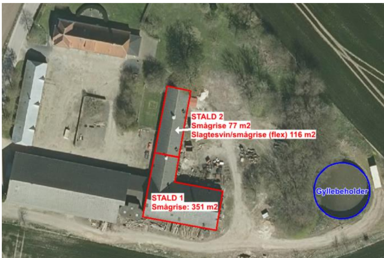
Figur 1. Det ansøgte dyrehold på Follerupvej 32

Det ansøgte produktionsareal til dyrehold på Follerupvej 32 er i alt 544 m 2 . Se Figur 1: