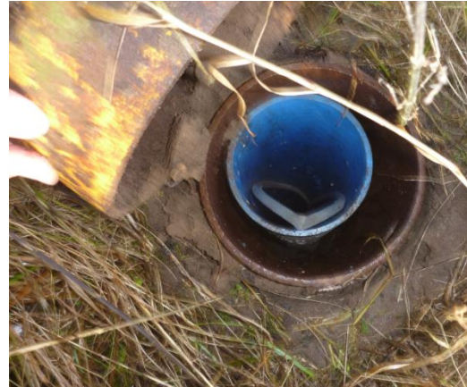
Boring DGU 191.251