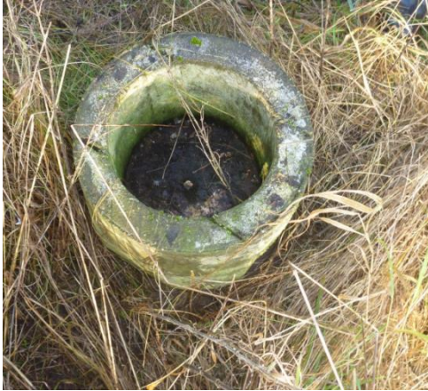
Boring DGU 191.158