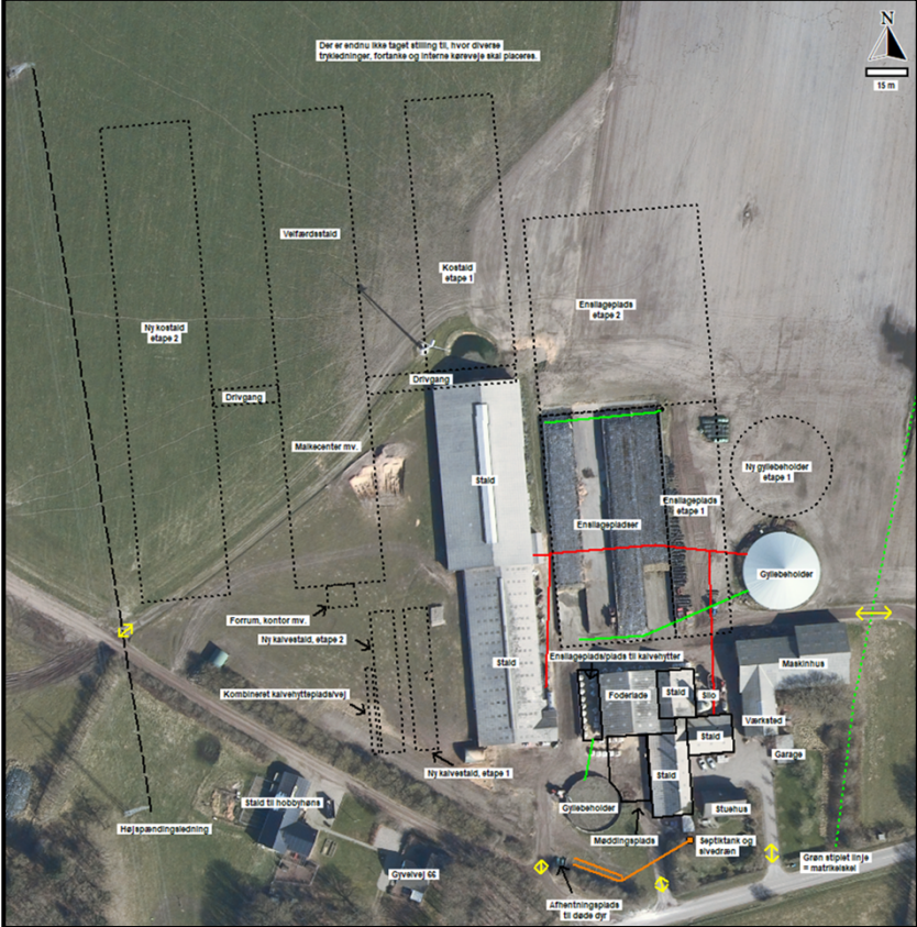
Figur 1: Placering af staldanlæg mv.

Oplysninger om ejendommens indretning og drift fremgår af nedenstående figur og tabel.