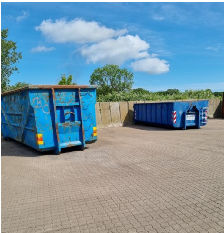
Container med jernskrot og rustfrit