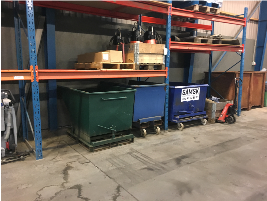
Der er ingen gulv afløb i lagerhal. Affald er oplagret i ca. 20-30 tipcontainere af 400-750 liter