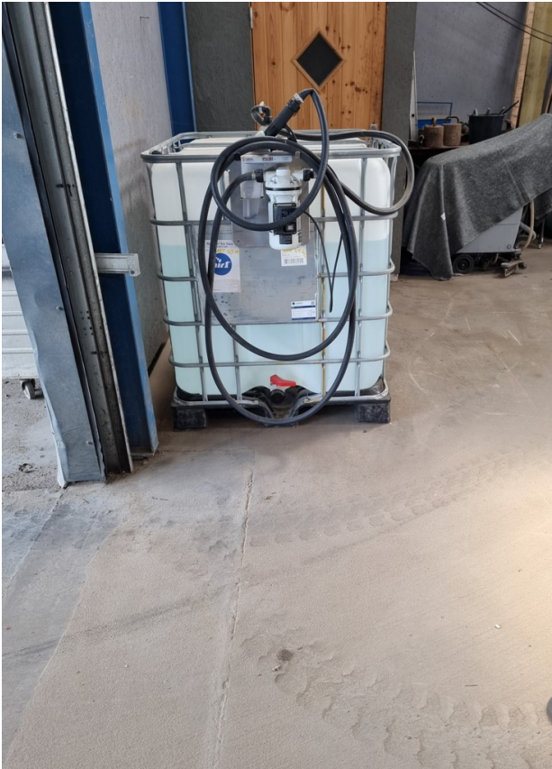
Pallettank med Adblue

Der opbevares en pallettank med AdBlue lige indenfor portåbningen ved vaskepladsen. På tilsynet blev det aftalt, at der etableres opsamlingskapacitet under tanken, da der er risiko for, at eventuel spild vil løbe til kloak.