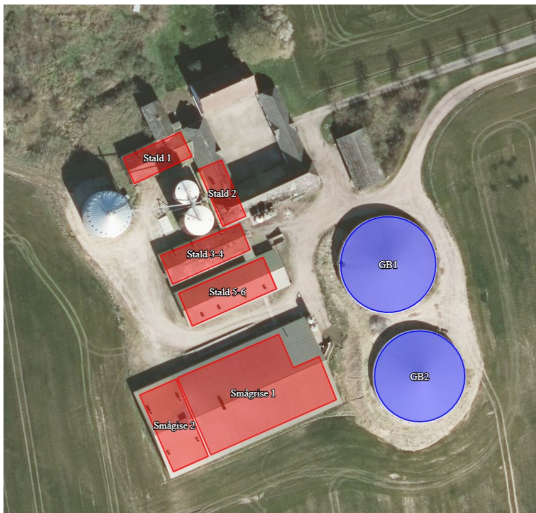
Figur 1: Oversigt over produktionsarealet på Simmersholm, Gl Skolevej 10, 5683 Haarby.

Der er søgt om husdyrtilladelse til det eksisterende produktionsareal på Simmersholm, Gl Skolevej 10, 5683 Haarby.