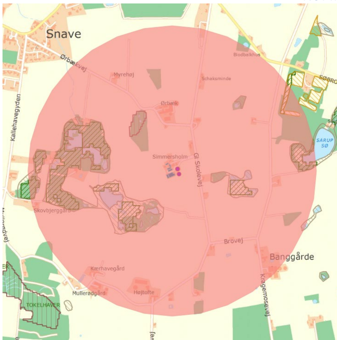
Figur 3: Oversigt over kategori 3-natur (skraveret) indenfor 1.000 meter af staldanlægget på Gl Skolevej 10 (Simmersholm).

Jf. beskrivelsen af kategori 3-natur ovenfor vurderes depositionen af ammoniak i enge og søer ikke, da de som udgangspunkt er robuste naturtyper.