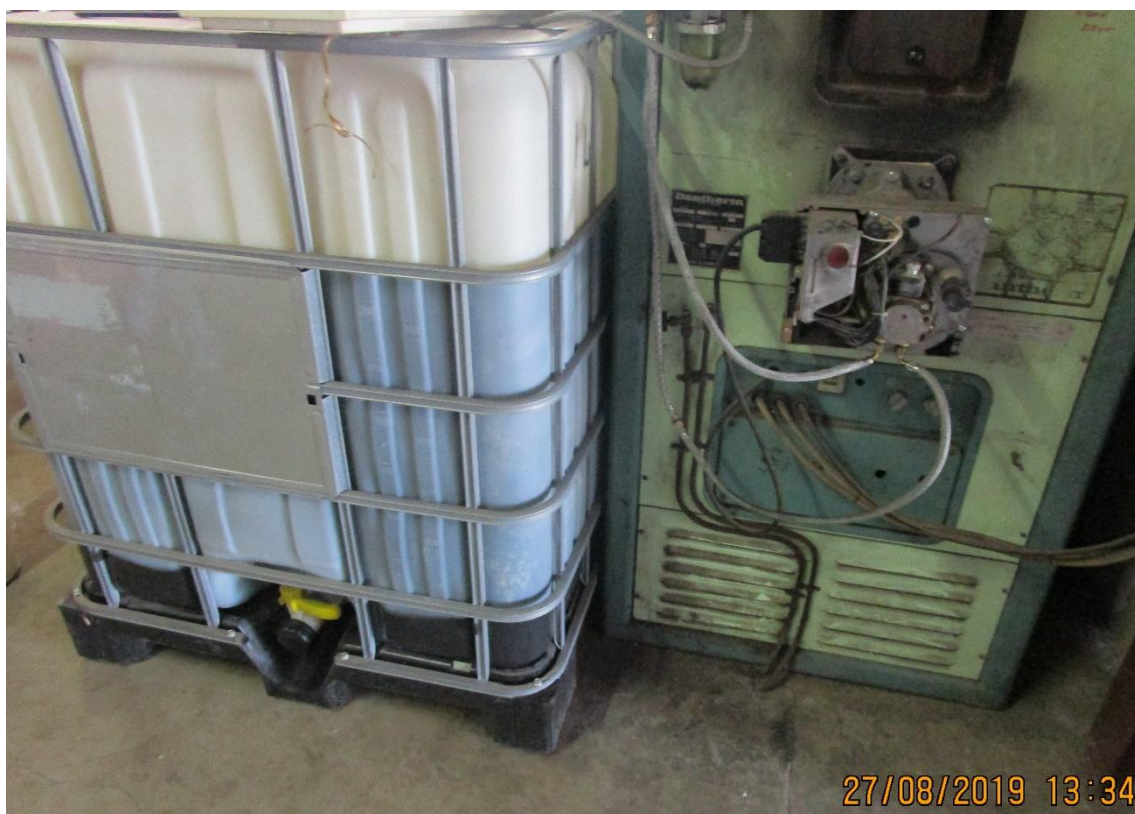
Billede af palletanken, som bruges til at opbevare olie i til oliefyret.

https://silkeborg.dk/Borger/Miljoe-energi-og-affald/Miljoe/Olietanke