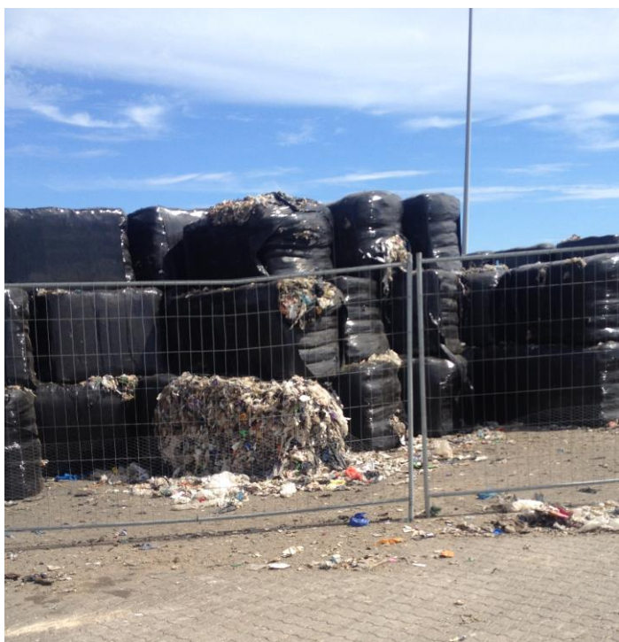
Billede 1. Hul på baller

I jeres ansøgning om miljøgodkendelse har I oplyst at affaldet ville være wrappet med 6-8 lag plastic. Ved tilsynet var det dog tvivlsomt, hvorvidt affaldet var wrappet disse antal gange.