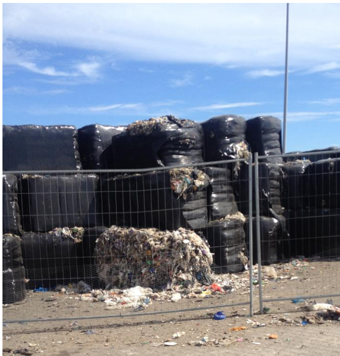
Billede 3. Hul på baller og affaldsflugt.

Ovenstående er overtrædelser af vilkår i jeres miljøgodkendelse af den 9. september 2015, se nedenstående: