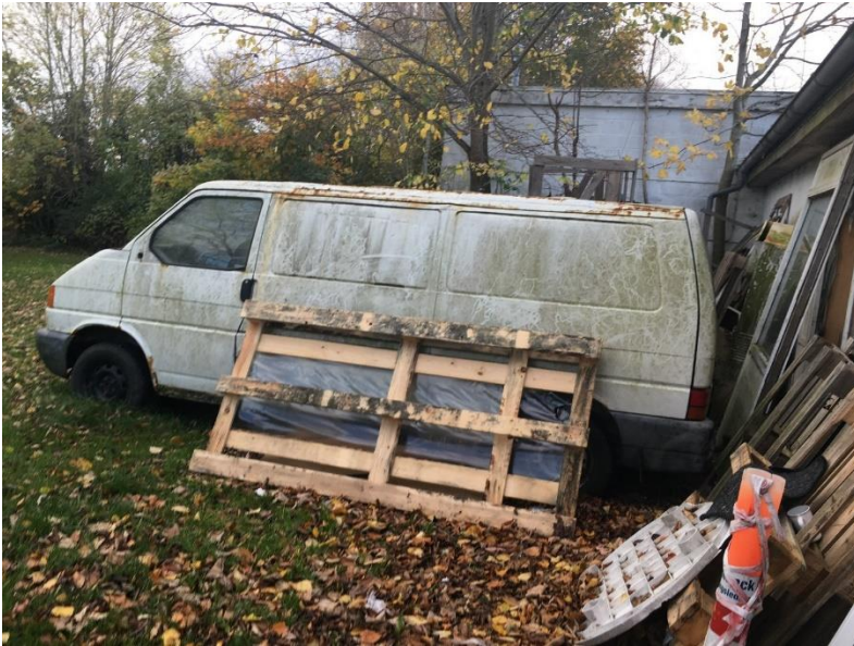
Udtjent bil på matriklen