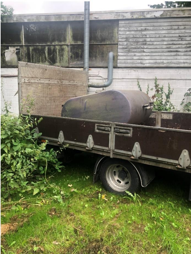
Bortkørt 1200 liters olietank fra 1984

Tankene til brændstof og rørføringer er ifølge Brian Petersen med automatisk lækagekontrol.