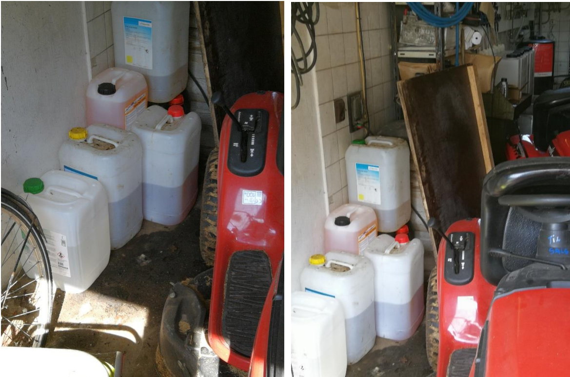
Dunke med sæber på gulv udenfor spildbakke.

Der opbevares dunke med sæber og behandlingsmidler på gulv med tæt i værkstedet. Dunkene skal opbevares i spildbakke der kan rumme indholdet af den største dunk.