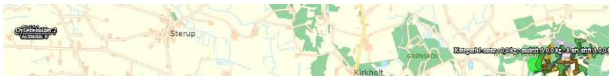
Figur 2. Kategori 1-natur.

Dernæst er det beregnet, hvor meget ammoniak fra husdyrbruget, der deponeres i de nærmestliggende kategori 1- og 2-naturområder. Naturområderne er vist på kortene i figurene nedenfor.