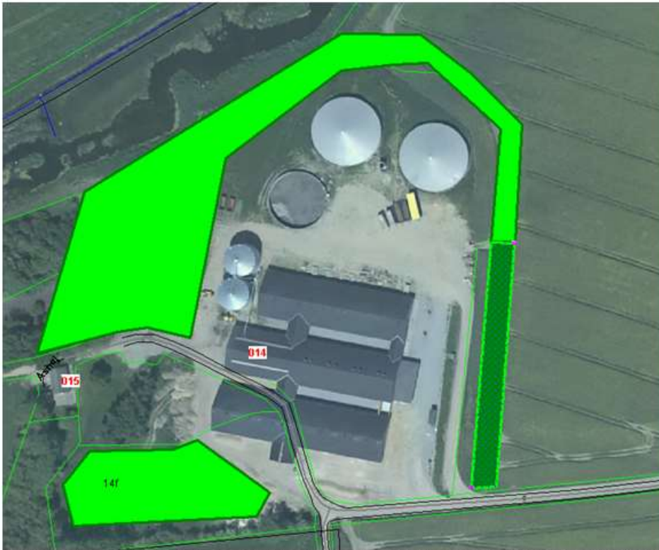
Figur 7.1: Nord ↑ Beplantningsplan i forbindelse med udvidelsen. Det lysegrønne markerer den omtrentlige placering af den skærmende beplantning i vilkår 7.1.1.

"Efter nedrivning af de gamle staldbygninger skal der etableres beplantning på arealet. Denne beplantning skal føres videre nord – nordøst forbi gylletankene. Beplantningen skal bestå af egnstypiske arter, være tæt i bunden, og med en højde på mindst 4 meter. Den omtrentlige placering af beplantningen kan ses nedenfor i figur 7.1."