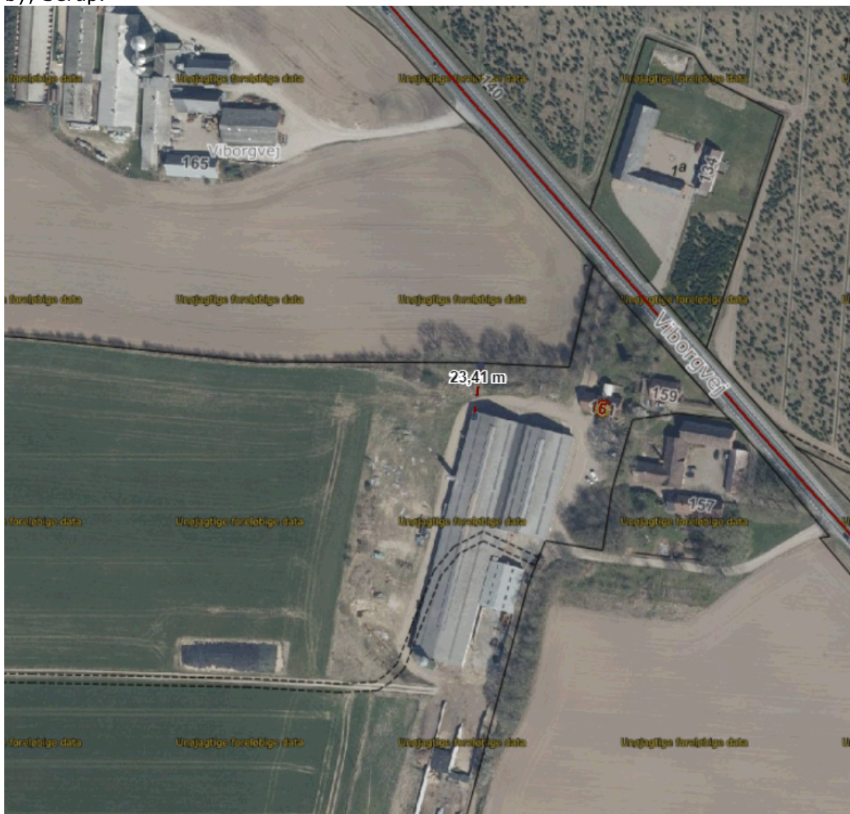
Figur 1. Oversigtskort over den berørte stald og naboskel

Der er tale om den eksisterende kostald som er placeret 23 meter fra naboskel 2a, Resdal by, Serup.