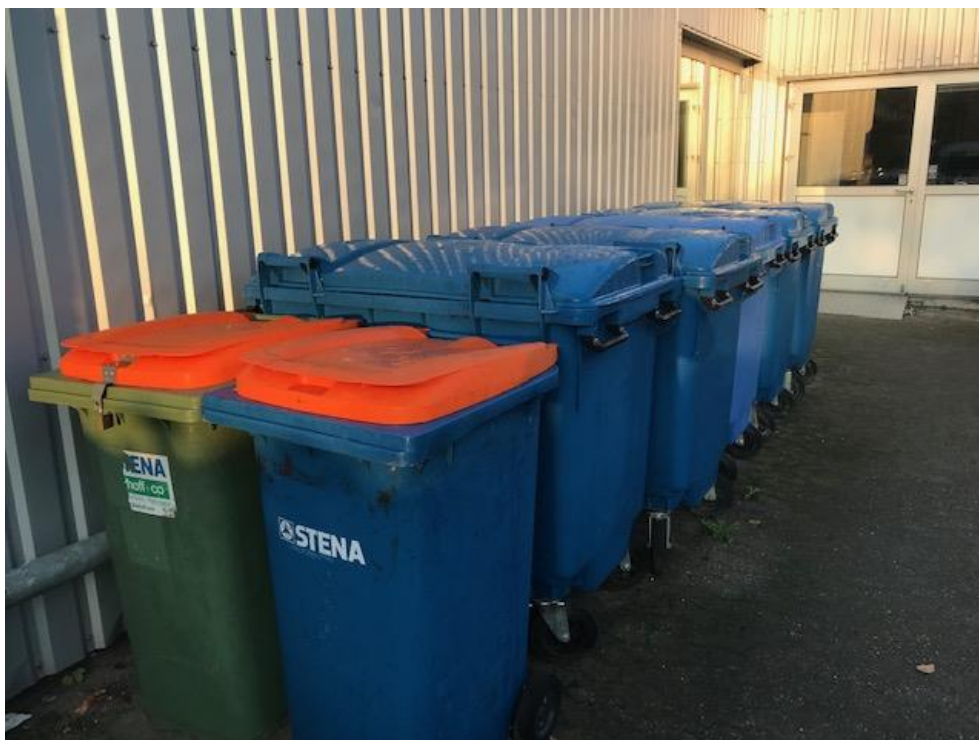
Billede 1. Opbevaring af pap og papir

Opbevaring af pap og papir foregår i containere, se nedenstående billede 1.