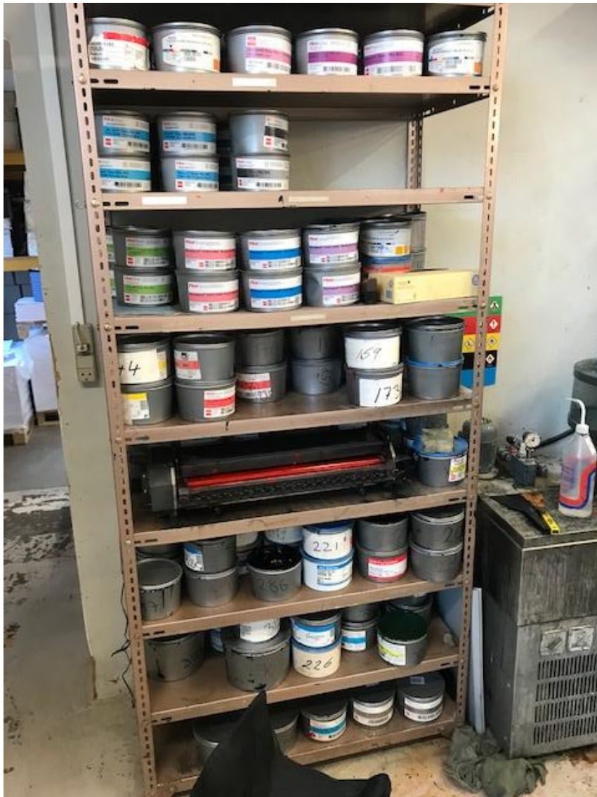
Billede 2. opbevaring af kemikalier

Virksomheden opbevarer råvarer på reoler (farver).