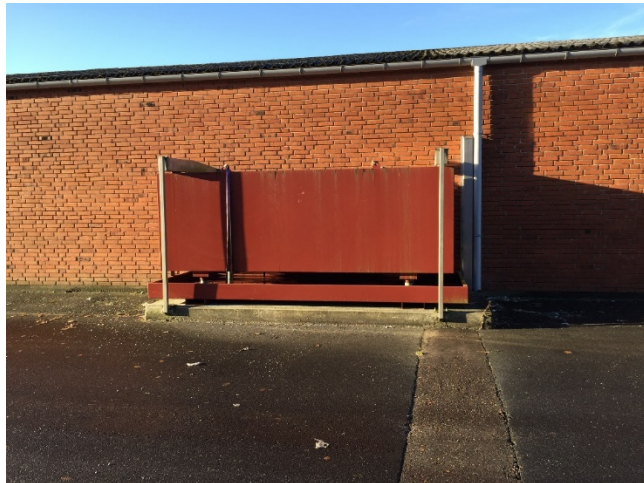
Overjordisk olietank – anlægsnr.: 1 i BBR, den 24. november 2016.

http://www.thyholmolie.dk/tankanlaeg/tankattester.aspx