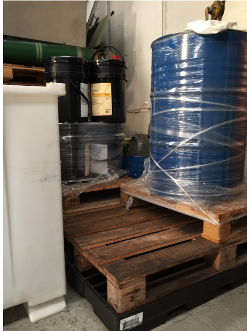
Diverse kemikalier placeret indendørs på spildbakke, den 24. november 2016.