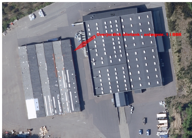
Placering af overjordisk olietank, den 24. november 2016.