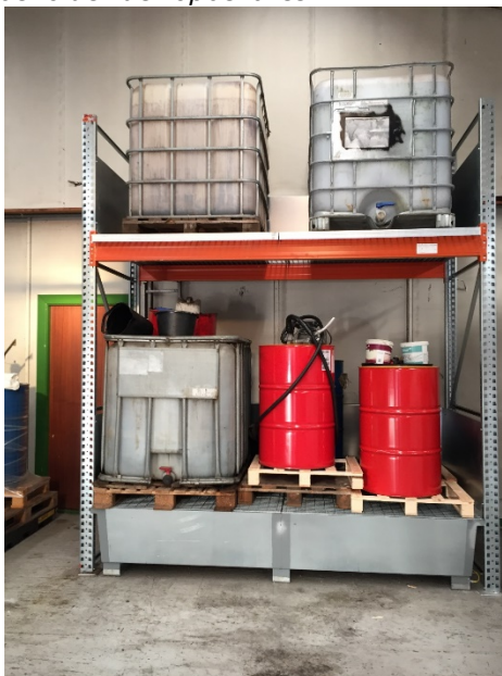
Olie og spildolie placeret indendørs på spildbakke, den 24. november 2016.