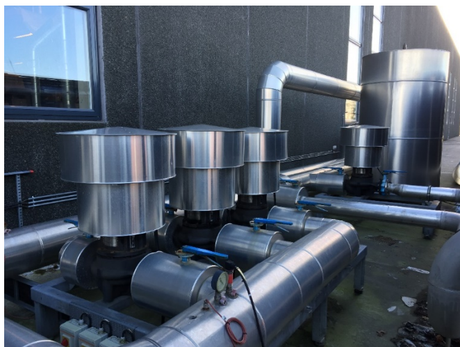
Støjafskærmning om dele af køleanlægget, den 24. november 2016.