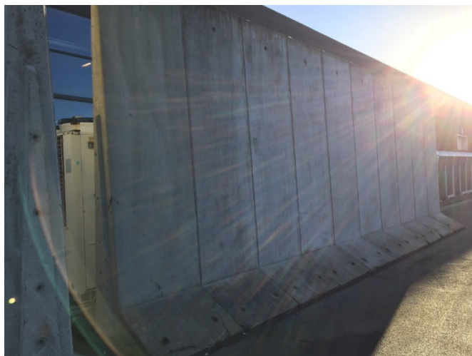
Støjmur omkring køleanlæg, den 24. november 2016.