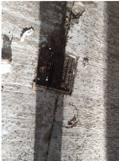
Afproppet afløb i hal med ethylenglycol, den 24. november 2016.

Ved tilsynet var farligt affald og kemikalier placeret indendørs og på spildbakker. Ethylenglycol var ikke placeret på spildbakker. Der er fald mod afløb i hallen, men afløbet er afproppet. Kommunen vurderer derfor ikke, at det udgør nogen risiko for miljøet. Indskærpelsen er efterkommet.