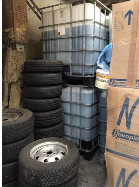
Pallettanke med ethylenglycol placeret indendørs, den 24. november 2016.