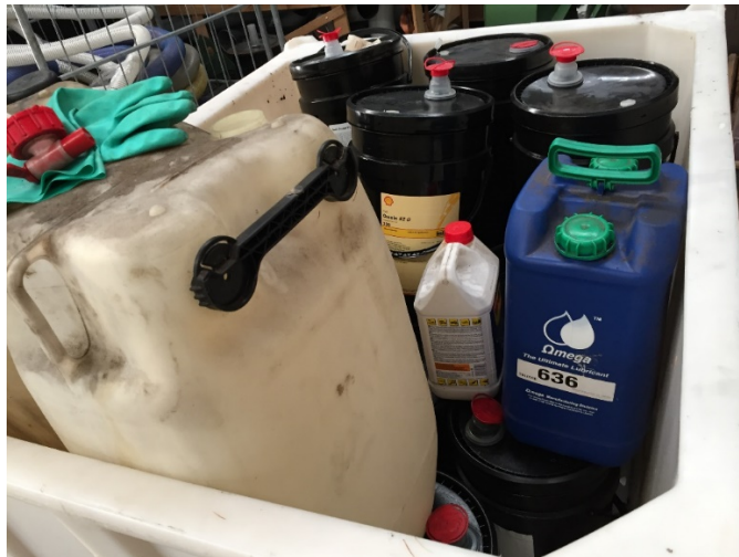
Diverse kemikalier placeret indendørs i spildbakke, den 24. november 2016.