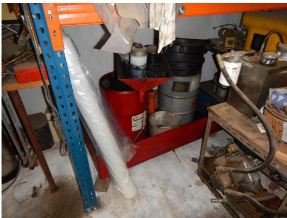
3. Spildolie på spildbakke.