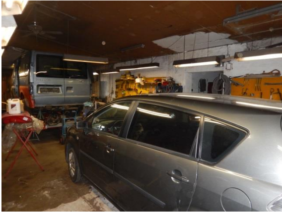
1. Værksted mod p-plads.