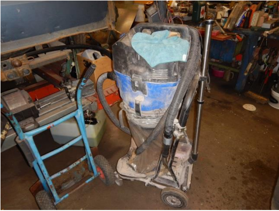
7. Mobil udsugning til slibestøv.