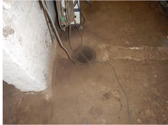
2. Afløb i værksted på billede 1.