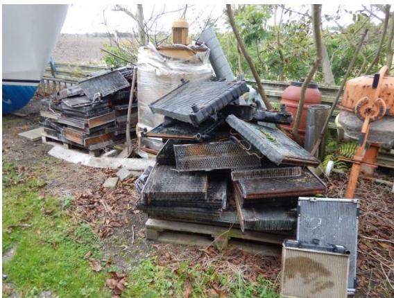
5. Brugte kølere (metallaffald).