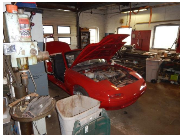
6. Sydligt værksted mod p-plads.