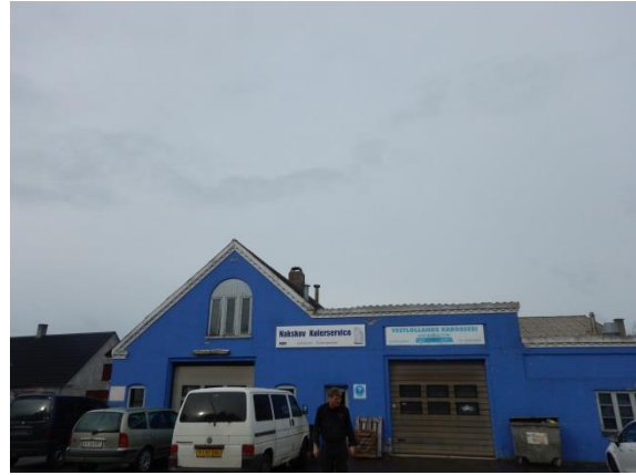
8. Afkast fra værksted.