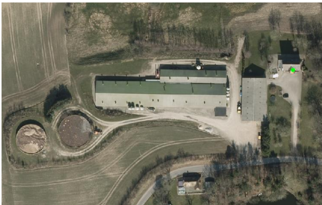
Figur 1: Anlægsoversigt Vedtoftevej 20, 5620 Glamsbjerg (Brændegård).

I ansøgt drift er der 434 stipladser med delvis spaltegulv, med en produktion på 420 årssøer (31,5 stk. fravænnede grise pr. årssø), og i smågrisestalden er der 2.280 stipladser med delvis spaltegulv med en produktion på 14.820 smågrise (7,20-30 kg). I polteafdelingen er der 35 stipladser med delvis spaltegulv med en produktion på 175 polte (45-102 kg), hvilket giver en samlet produktion på 164,51 DE.