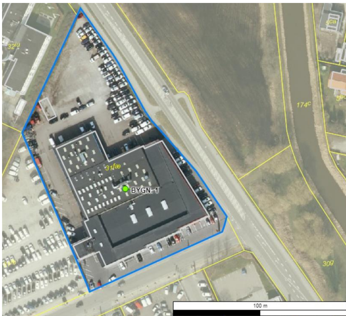
Luftfoto af virksomheden med matrikelskel

I forhold til kommuneplanen ligger virksomheden i område 150803ER, der er udlagt til erhvervsformål. Området er desuden omfattet af lokalplan 263 – Bolig og erhvervsområde nord for Ravnsøvej. Der kan etableres en bolig i tilknytning til den enkelte virksomhed. Nærmeste boliger ligger i en afstand af ca. 80 meter øst for virksomheden.