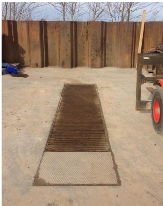
Afløb fra vaskeplads

Virksomheden ligger i et separatkloakeret område, hvor overfladevand afledes til recipient og spildevand afledes til renselanlæg, der ejes og drives af Aarhus Vand A/S. Virksomheden er meddelt spildevandstilladelse den 16. marts 2017 til afledning af vaskevandet. Men det er i tilladelsen en forudsætning, at vaskepladsen er overdækket, hvilket også er oplyst i tegningsmateriale til ansøgningen, for at undgå afledning af regnvand fra pladsen til spildevandssystemet. Ved tilsyn i 2019 kunne det konstateres, at virksomhedens vaskeplads til vask af maskiner var etableret som en udendørs betonbelagt vaskeplads med et areal på ca. 100 m 2 , hvilket er væsentligt over de 25 m 2 , som kan accepteres uden overdækning.