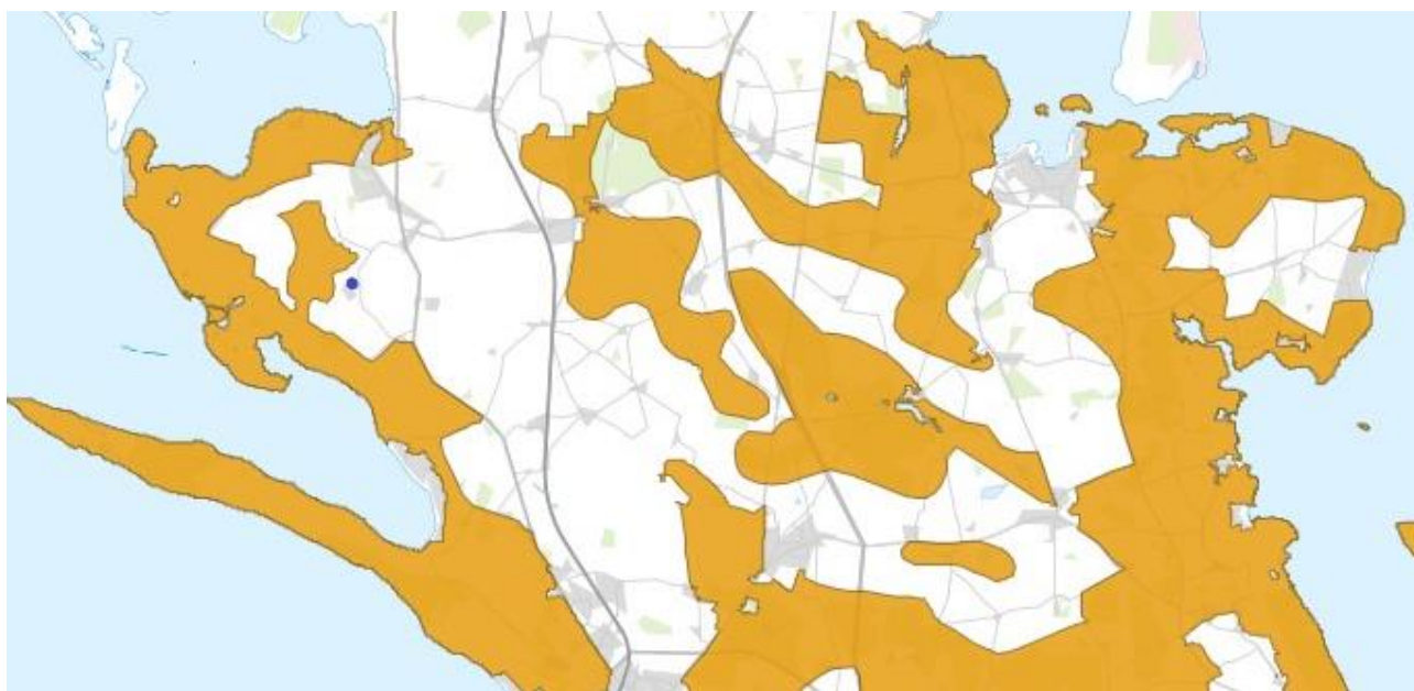
Figur 2: Udklip fra kommuneplan 2018, områder med landskabelig værdi, markeret med orange. Husdyrbruget er markeret med sort prik, beliggende udenfor området.

Efter § 10 stk. 4 i husdyrgodkendelsesbekendtgørelsen, skal kommunen sikre at opførelse af malkestalden ikke væsentligt påvirker områder, der i kommuneplanen er udpeget med særlige bevaringsværdier, herunder kulturhistoriske, geologiske eller landskabelige værdier. Betingelsen i § 10 stk. 4 er påset, ejendommen befinder sig ikke i et område med særligt værdifuldt landskab.