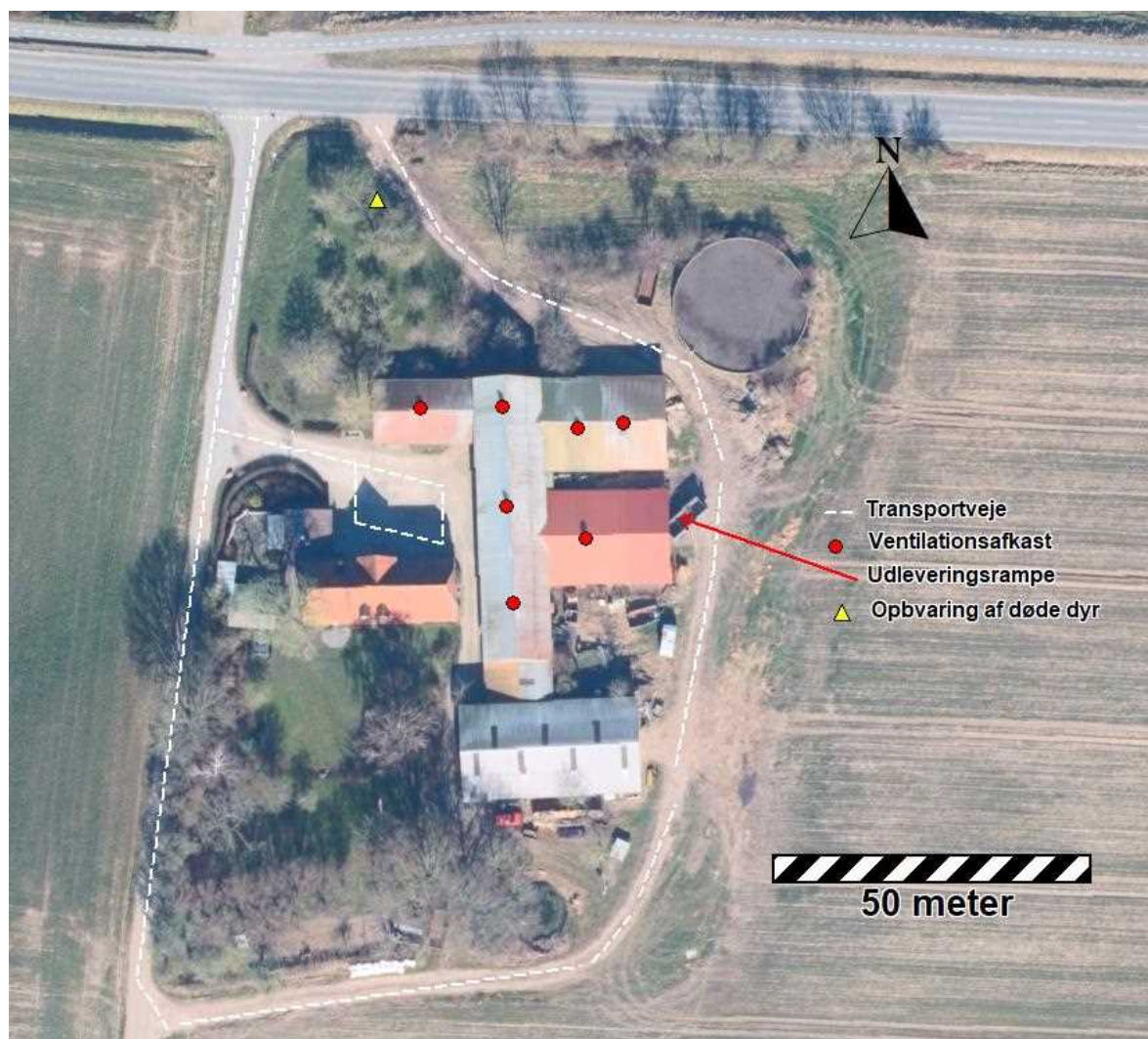
Figur 3: Mulige gener fra husdyrbrugets drift.

Dette afsnit beskriver de emissioner og mulige gener, der kan forekomme i forbindelse med den ansøgte husdyrproduktion på Søndre Landevej 158, 6400 Sønderborg. Af figuren nedenfor fremgår placeringen af de aktiviteter der kan medføre gener.