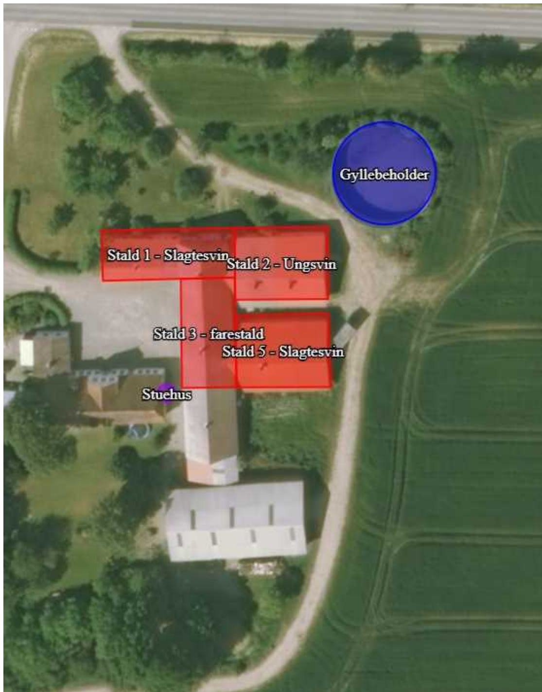
Figur 1. Oversigtskort over produktionsarealer (rød) og gødningsopbevaringsanlæg (blå)