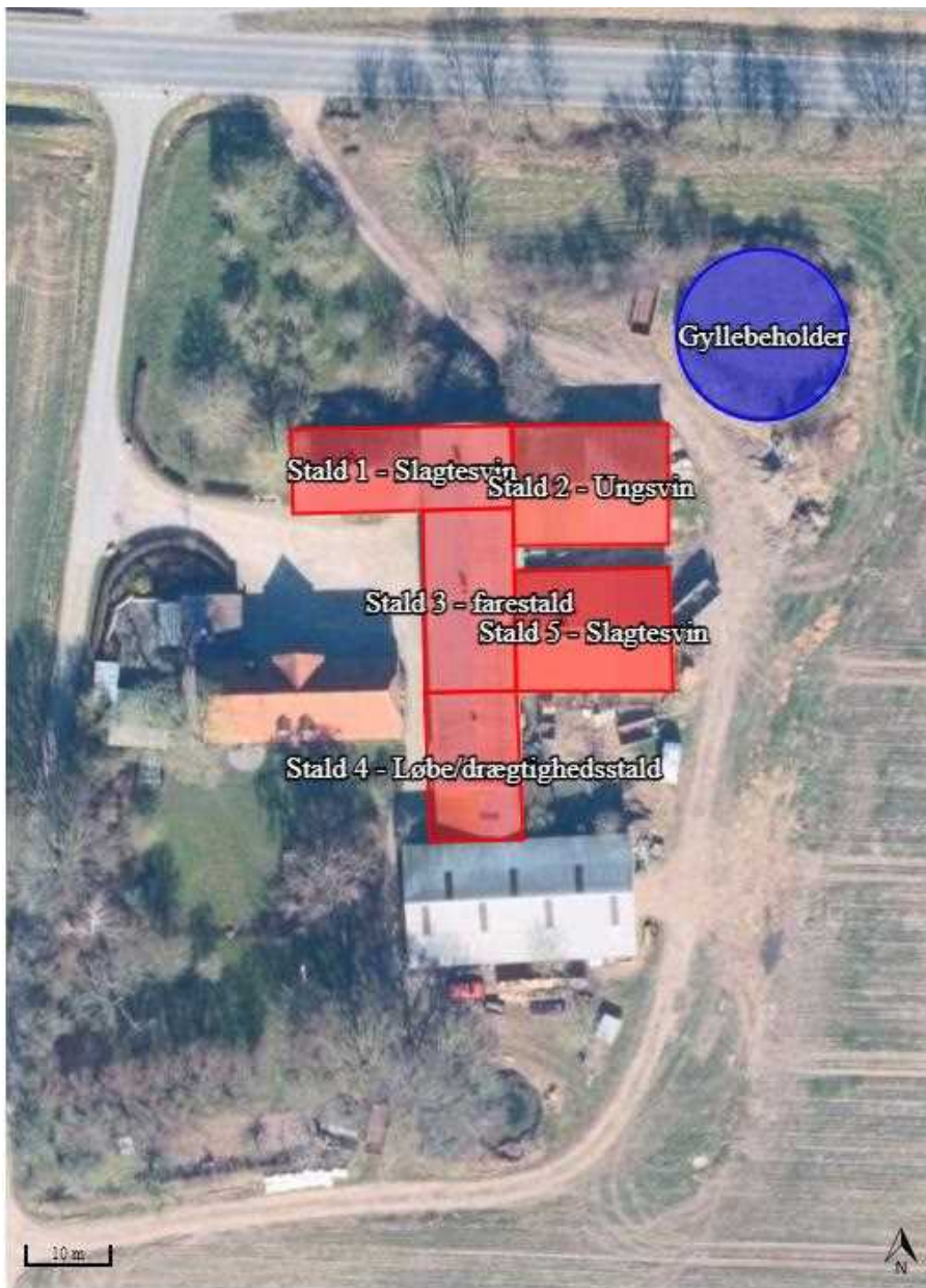
Figur 1: Husdyrbrugets stalde og gødningsopbevaringsanlæg.