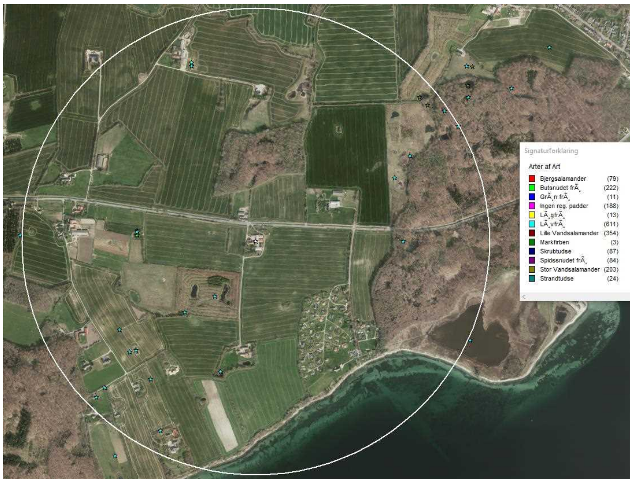
Figur 2: Mulige bilag IV-arter i nærheden af husdyrbruget. Den hvide cirkel har en radius på 1 kilometer fra husdyrbruget.