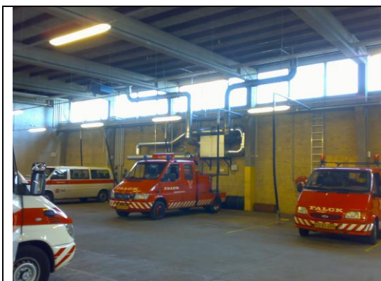
Ventilationsanlæg slanger til udsugning af udstødningsgas.

Der er etableret et samlet udsugningsanlæg i tilslutning til virksomheden 2,5 m over tag for udstødningsgasser, fra i alt ca. 16 stk. slanger.