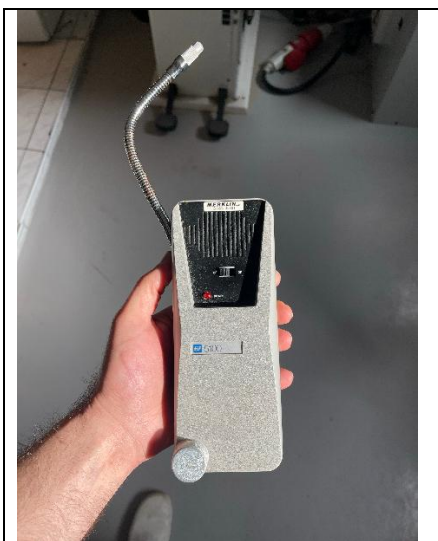
Figur 7: Lækagesøger.