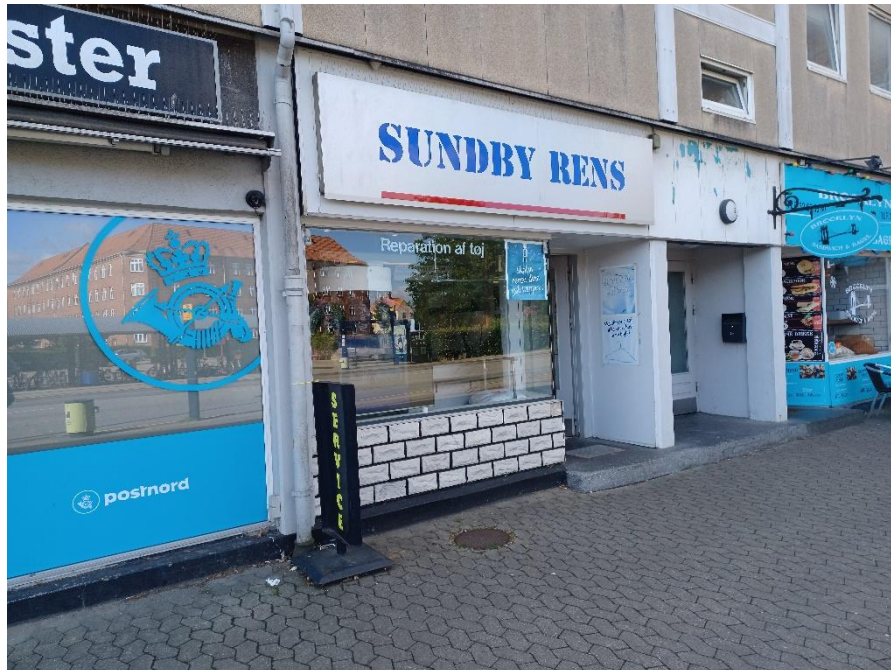
Figur 1: Renseriets beliggenhed på Sundbyvester Plads i en etageejendom med boliger.