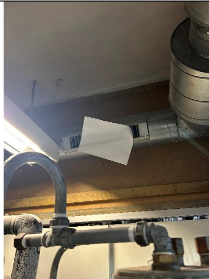
Figur 4: Papirkontrol