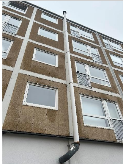
Figur 5: Afkast over tagryg.

På tilsynet blev virksomhedens ventilationstæller også aflæst.