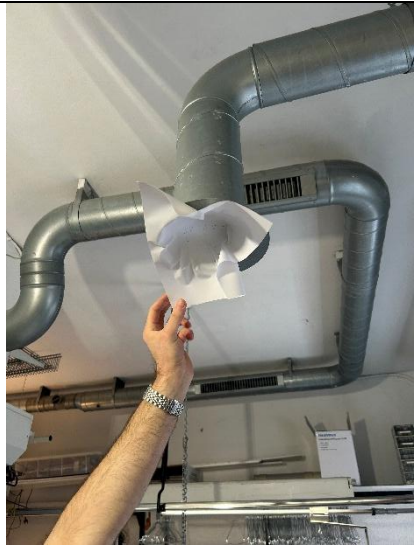
Figur 3: Papirkontrol