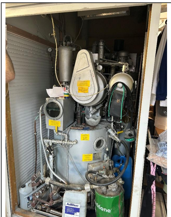
Figur 2: Renseriets rensesmaskine set bagfra med skydeforhænget trukket fra.