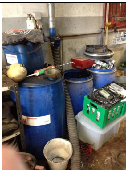
Foto 4 tromler til spraydåser mv.