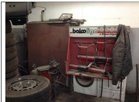
Foto 1 overjordisk tank til oliefyrr