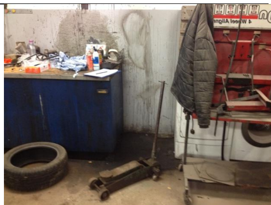
Foto 2 Spildeolie tank m spildevand på gulv og væg