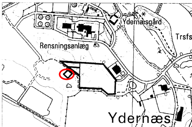
Fig. 3 Rød ring: området for nedsivning fra Afatek

Afatek Slaggesorteringsanlæg er nabo til Ydernæs Losseplads og nedsiver overskudsvand på Ydernæs Losseplads via en underjordisk rørføring. På tilsynet blev området besigtiget, men der blev ikke fundet synlige installationer. På fig. 3 ses området, hvor nedsivningsanlægget er beliggende.