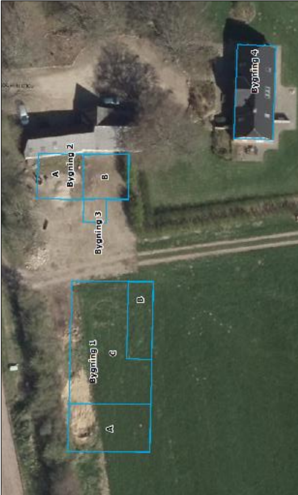
Bilag 2. Situationsplan over den fremtidige stald.