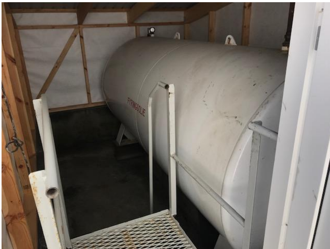
Billede 3. 5900 liters tank med fyringsgas fra 2010 i stål.