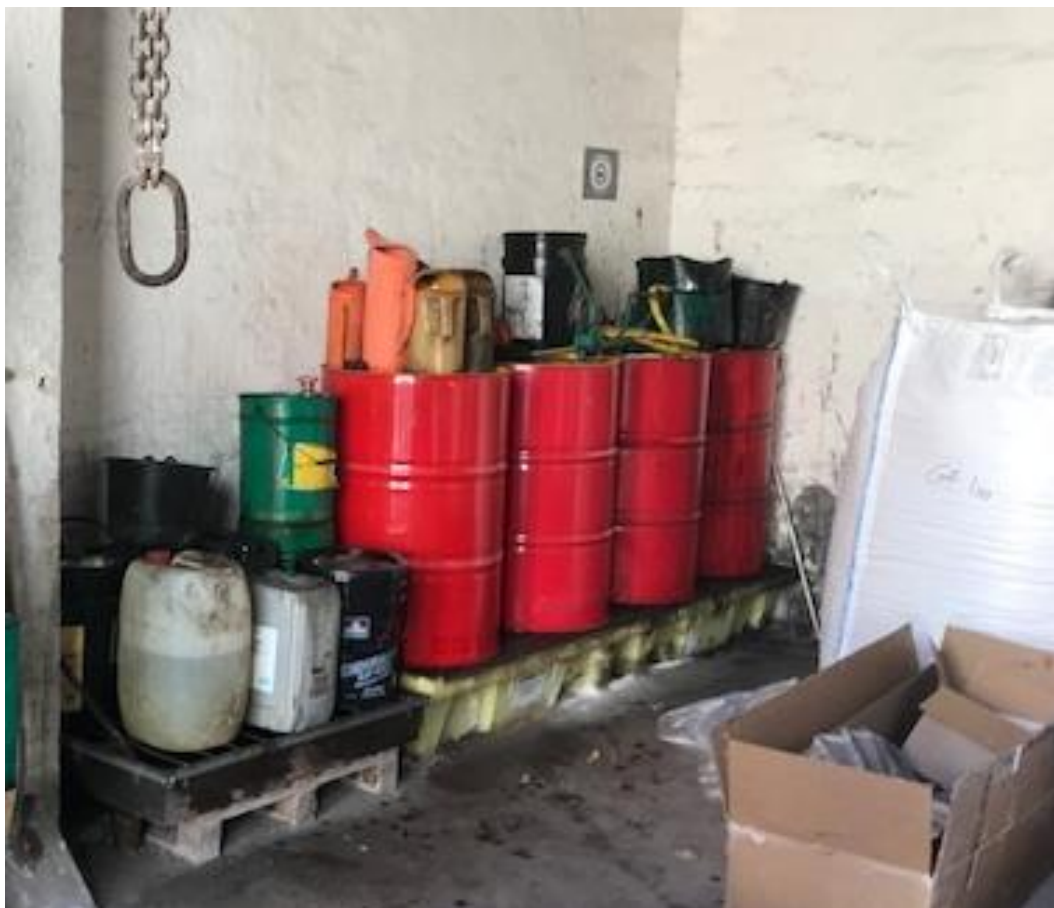
Billede 1. Virksomhedens opbevaring af kemikalier.

Virksomheden opbevarer kemikalier på spildbakker på et betongulv. Opbevaringen er miljømæssigt forsvarlig. Der er ikke risiko for forurening af verken jord eller kloak.