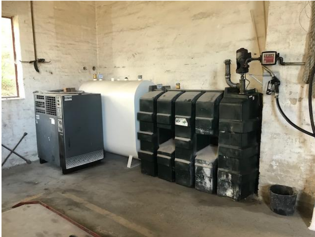
Billede 2. 1225 liters dieseltank fra 2007 i plastic samt 1200 liters tank med fyringsgas fra 2018 i stål.