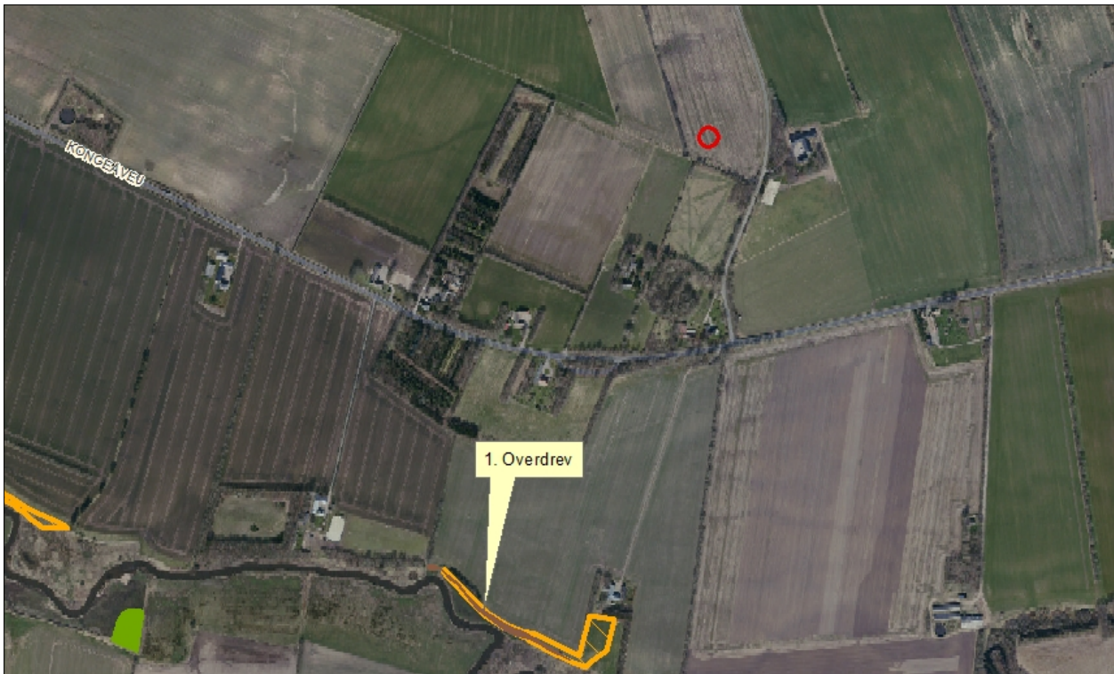
Figur 4. Kategori 1 naturområder ved anlægget.

Nedenstående tabel viser de kategori 1 naturområder, der påvirkes med ammoniak fra husdyrbruget.