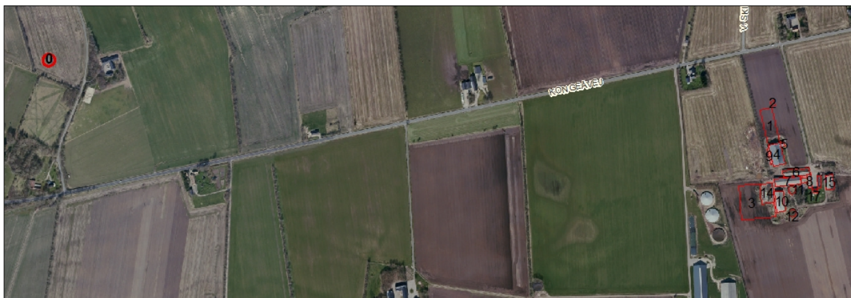
Figur 1. Husdyrbrugets driftsbygninger.

Denne godkendelse omhandler kun gyllebeholderen, der er tidligere givet godkendelse til ejendommens andre bygninger.