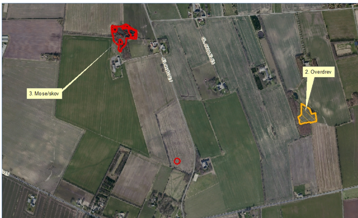
Figur 5. Kort over kategori 3 samt § 3 natur ved anlægget.

Naturtyperne er vist i nedenstående figur og tabel.