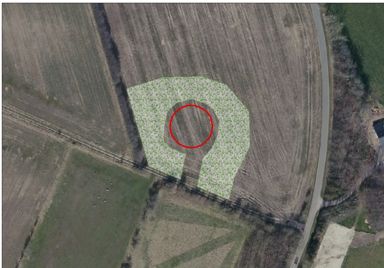
Figur 2. Beplantning ved gyllebeholderen.