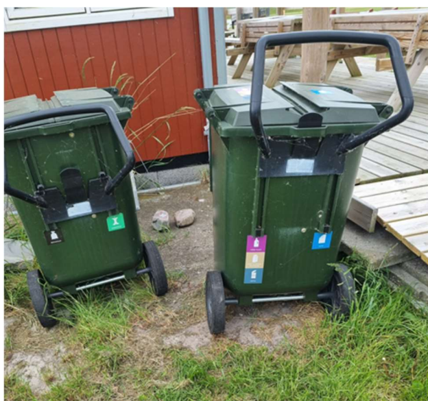
Affaldsspande til virksomheden affaldsfraktioner

Virksomheden foretager sortering af alle forekommende fraktioner og lever dermed op til kravene om affaldssortering.