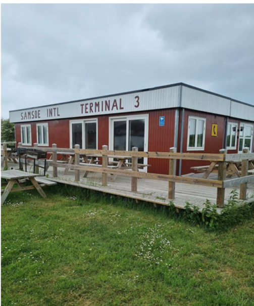
Kontor, ankomstværelse, tekøkken, wc mv.

Ved landingsbanen er der siden sidste tilsyn, opført en ny terminal med kontor, køkken og WC samt en hangarbygning/værkstedbygning.