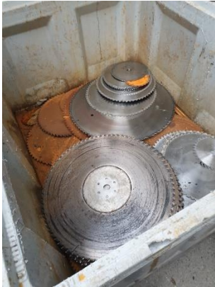
Indendørs opbevaring af metalaffald