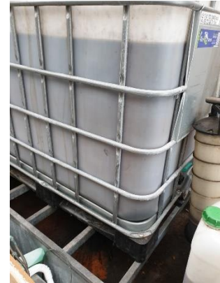
Indendørs opbevaring af spildolie på spildbakke

Hvis du har kommentarer til tilsynsbrevet eller tilsynsrapporten, skal disse være kommunen i hænde senest 3 uger fra modtagelsen af dette brev.