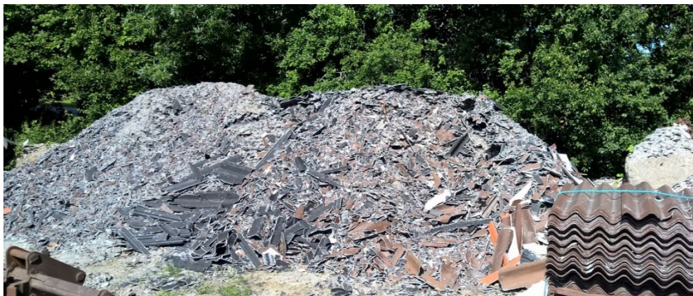
Knuste tagplader: sørg for dokumentation/analyse af, at tagpladerne ikke indeholder asbest!

Skal du udvide, renovere eller rive din ejendom ned, gælder der særlige bestemmelser for håndtering, sortering og bortskaffelse af bygge- og anlægsaffald, herunder tagplader med og uden asbest.