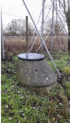
Boring 3 (DGU 238.1109)