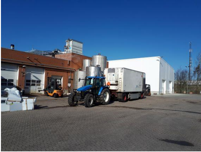
Testcentret er indrettet i den nye hvid bygning.