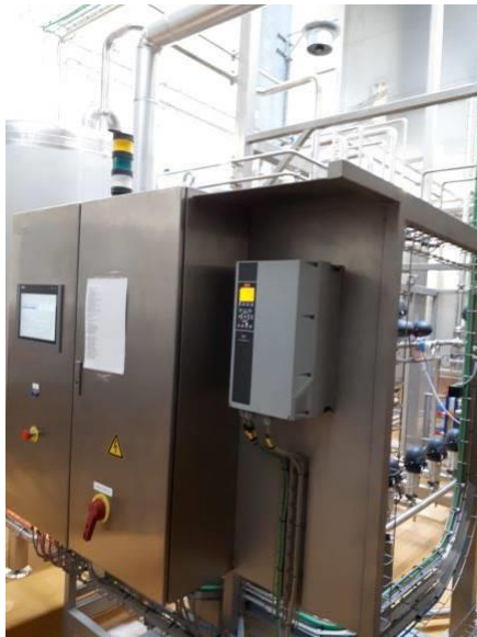
Styring af CIP.