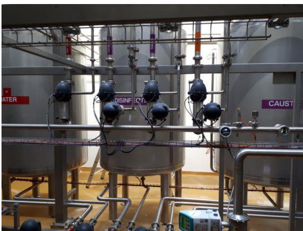
Tanke til CIP-rensning.