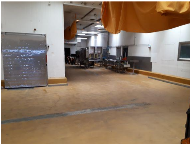
Gammelt udstyr fra frugthåndteringen.