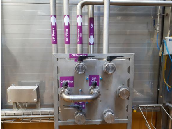
Styring af CIP.